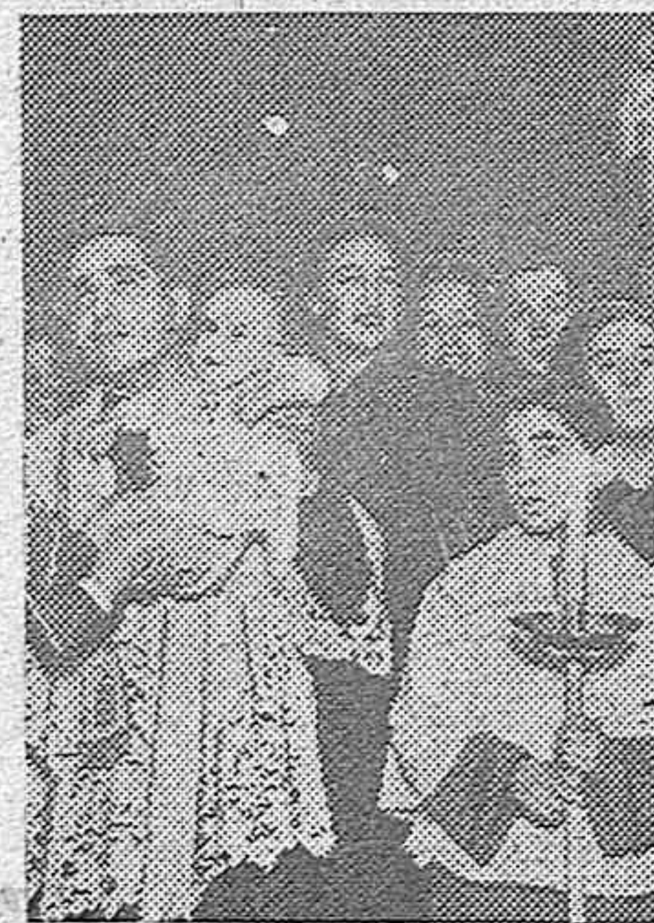
Bautizos de 12 niños celebrado en el distrito de la Universidad de Madrid, bajo el patrocinio de la Sección Femenina.