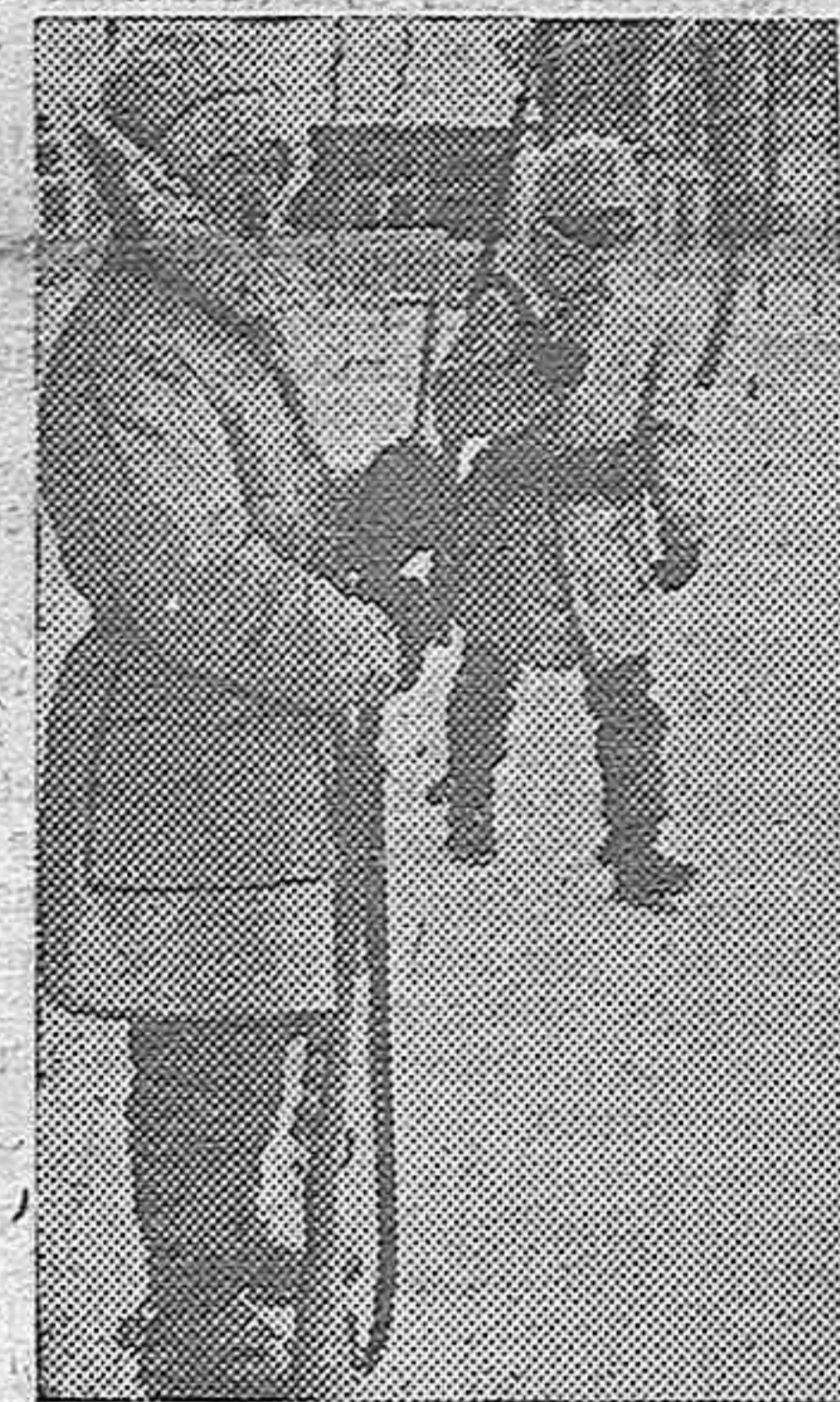
He aquí dos de los primeros voluntarios suecos llegados recientemente a Finlandia. Es de notar su buen equipo, con su abrigo impermeable y su gorro forrado de piel.