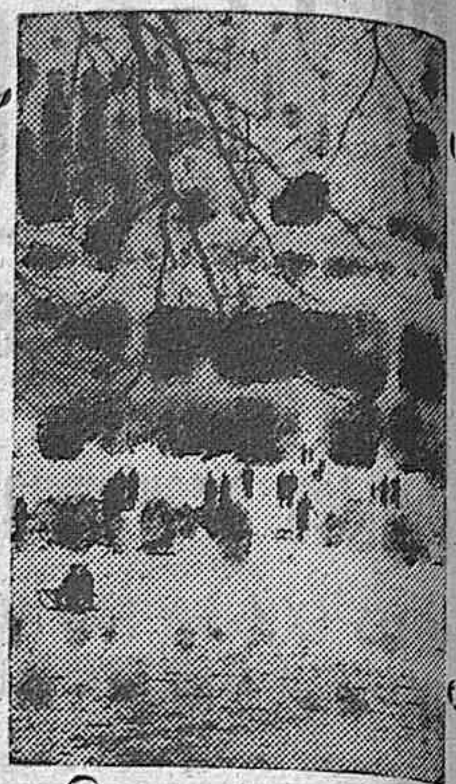
En las primeras horas de la mañana los lagos inmediatos a Berlín, helados completamente, ofrecen ancho campo de paseo y pista para patines y deslizadores.