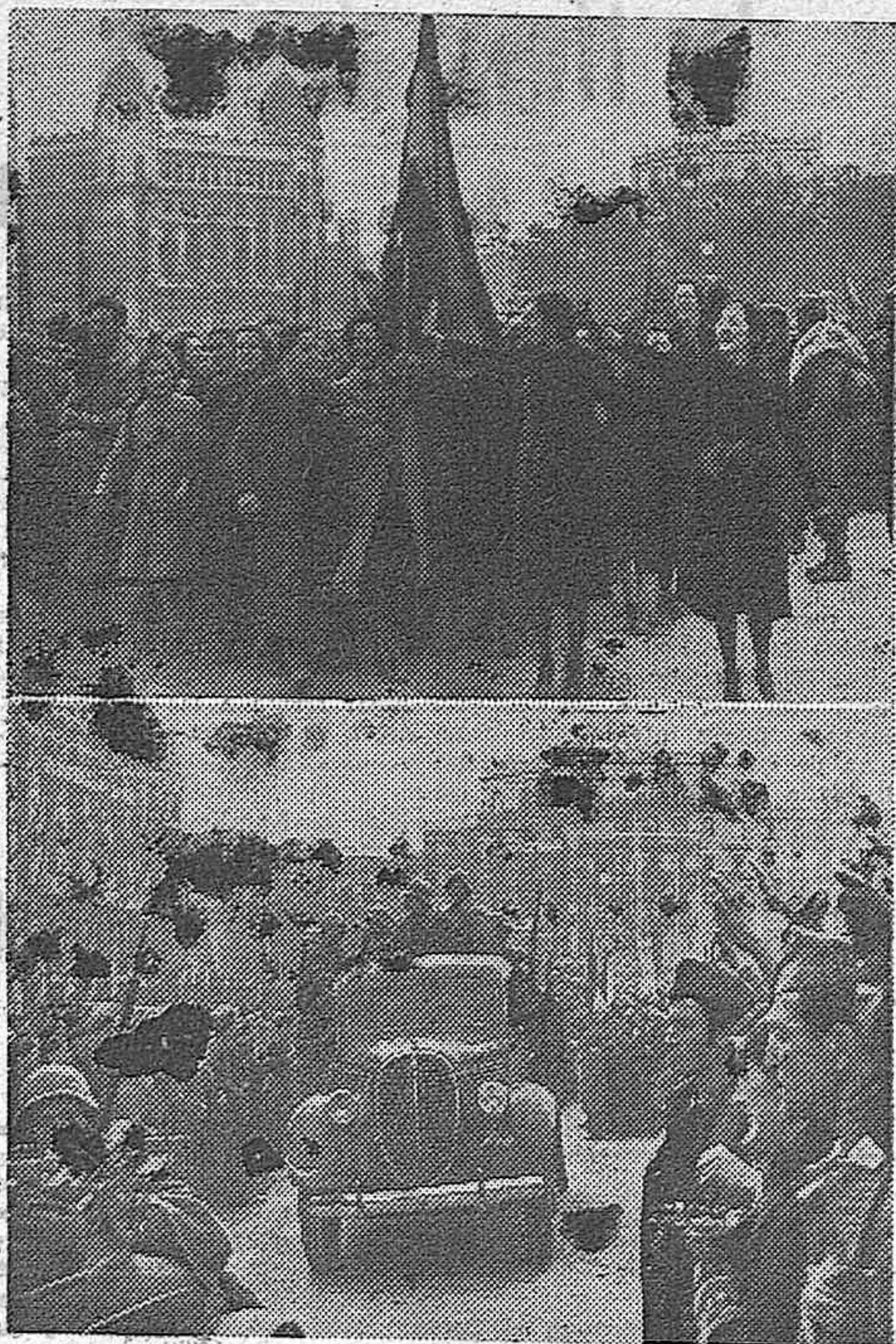
En estas fotografías históricas queda reflejado el entusiasmo del pueblo catalán, cuando quedaba, por fin, libre, hace un año, de la tiranía roja. Se puede advertir cómo izaban en sus brazos y ondeaban sobre las calles las banderas de sus liberadores y aclamaban, brazo en alto, a los soldados vencedores de España.

DIARIO DE LA MARANA Redacción: Capitán Calleja, 1 Administración: Mayor, núm. 15. Apartado, 24.-Teléfono, 8