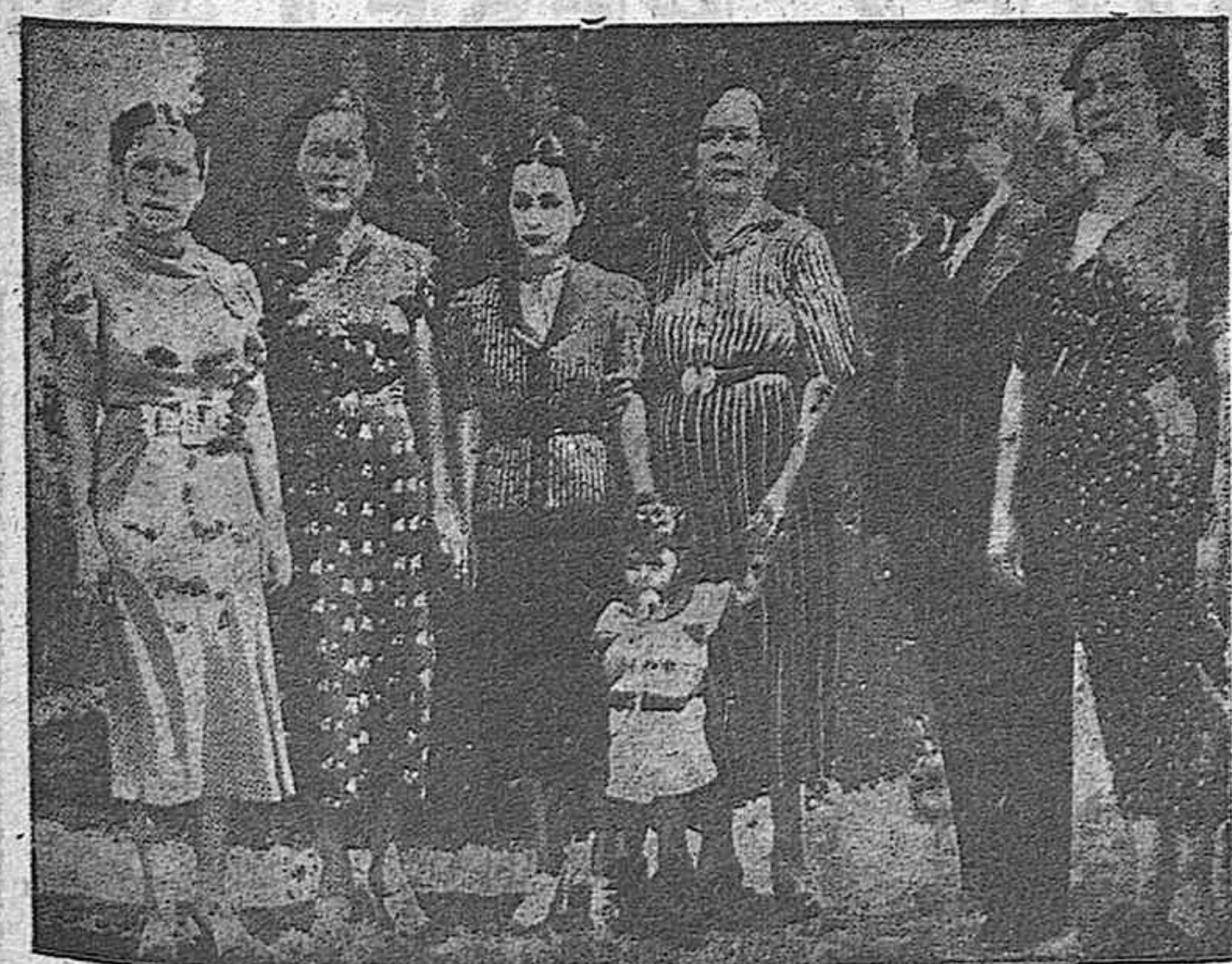
Hace días se ha registrado en Guanajuato, un complot revolucionario que fue sometido prontamente por las fuerzas federales. Se trataba, según los medios oficiales, de un lugarteniente del general Cuevas, quien se creía estaba escondido en el territorio. Este complot general revolucionario aparece en la presente foto, última que se hizo en Chihuahua, en compañía de su familia, antes de huir del país