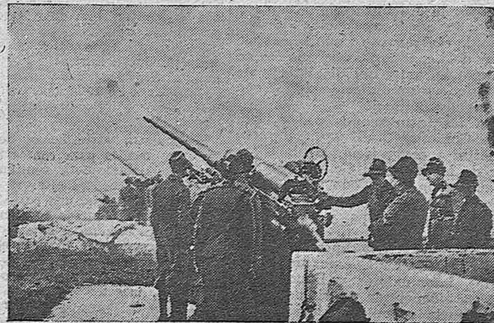
He aquí una batería de las poderosas baterías antiaéreas del Ejército italiano. Los jefes técnicos-militares asisten a unas importantes pruebas que se han realizado recientemente