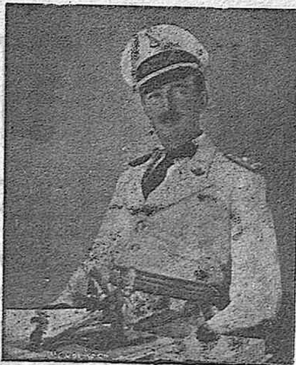
Mientras Italia prosigue su labor de protección abierta a la nación albanesa, bajo la política creadora del Duce, el que fue rey de Albania, continúa su éxodo por Europa, sin rumbo fijo