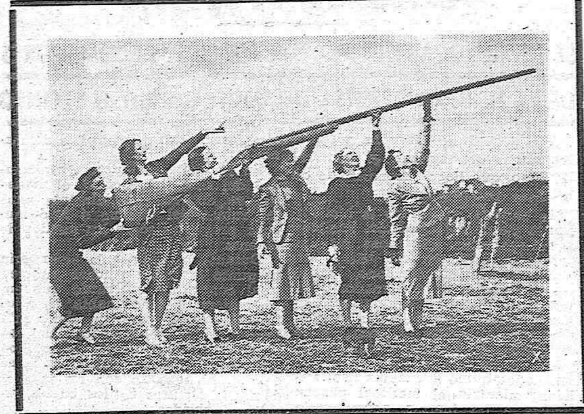
¿Creerá en serio Mr. Churchill poder chazar la invasión alemana con estas exhibiciones espectaculares, o piensa calmar con estas estampas los nervios de los que tienen que aguantar los bombardeos diarios de la Aviación alemana?