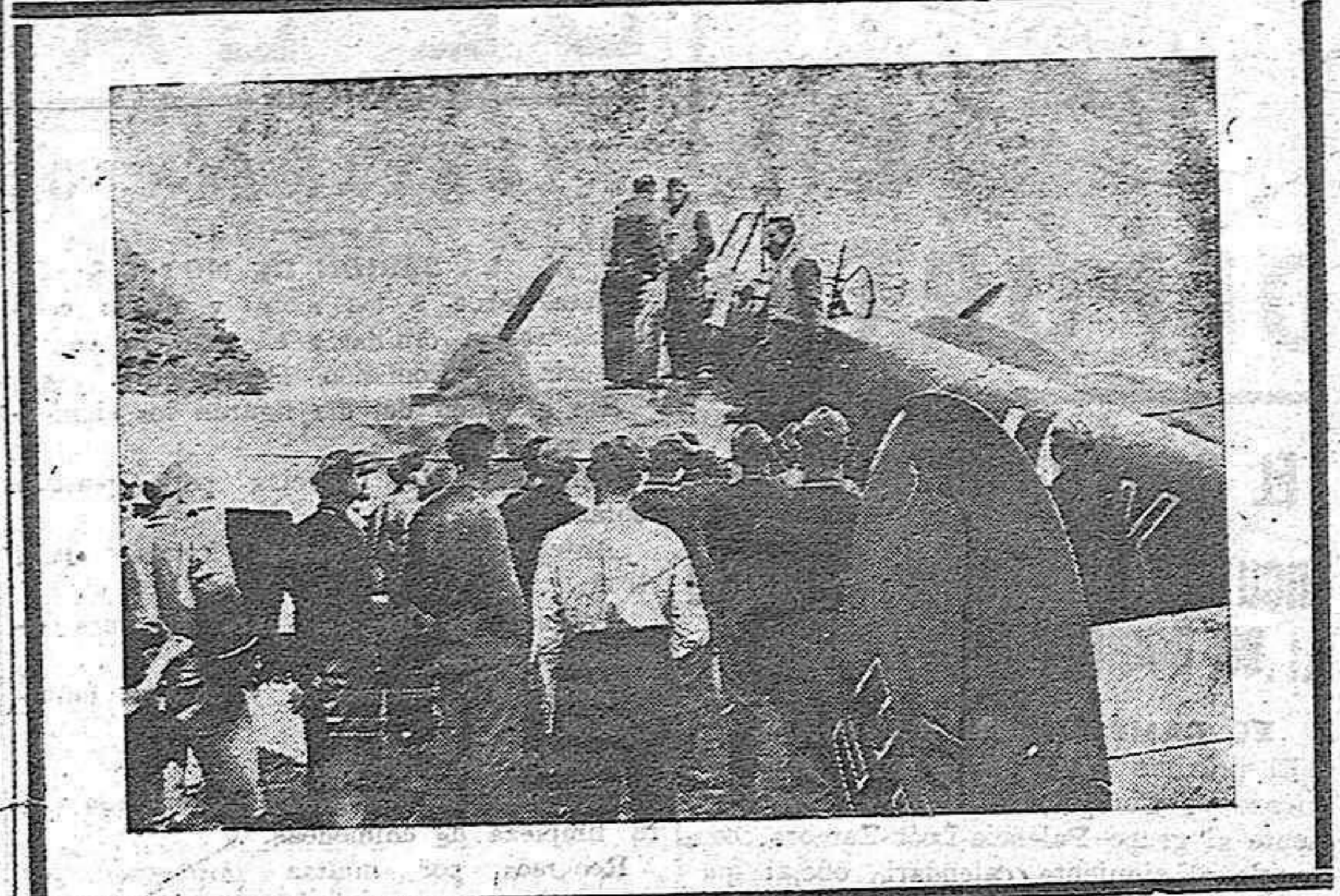
Una escuadrilla de destructores alemanes perdió un aparato en uno de los grandes bombardeos sobre Inglaterra. Ya se le había incluído entre las bajas, cuando se presentó en su base bajo el júbilo de los compañeros. He aquí la tripulación contando las peripecias del vuelo