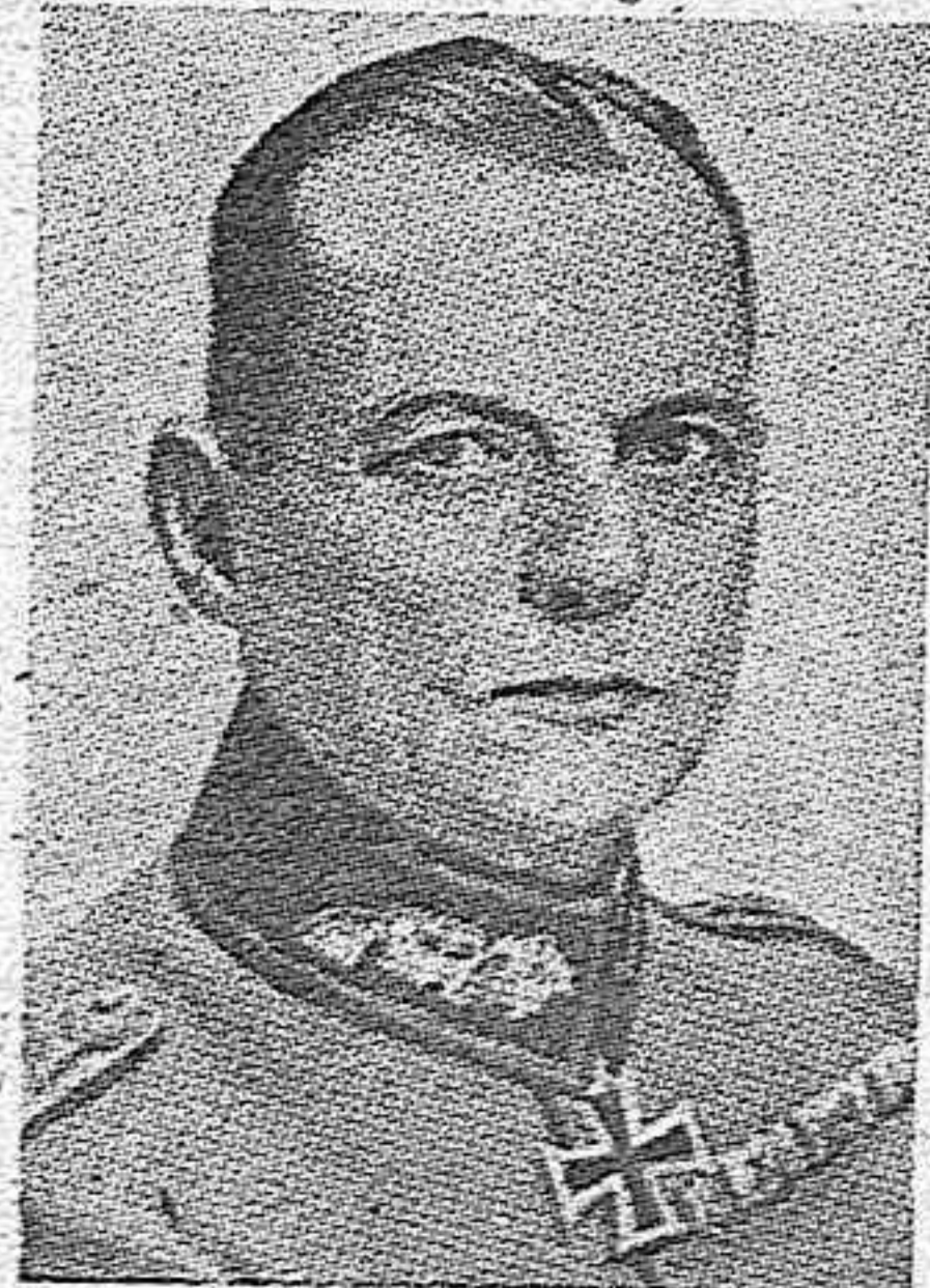
El general alemán Rundstedt, ascendido a Mariscal de Campo, y cuya brillante historia militar le destaca en el heroico Ejército del Reich.

LONDRES, 31.—Churchill ha inspeccionado las obras de fortificación de costa y las defensas del Nordeste. Así como los trabajos navales. Conversó con los oficiales y se interesó particularmente en los trabajos de «camouflage», dando muestras de satisfacción.—EFE.