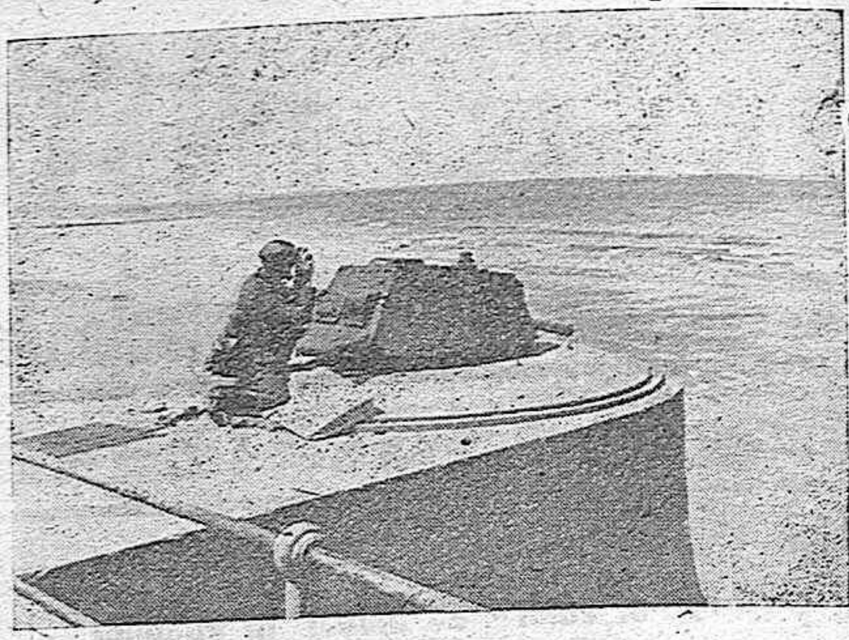
LA GUERRA EN EL MAR Desde el Cabo Norte hasta el Golfo de Vizcaya, las fuerzas armadas del Reich protegen las costas del Continente. Detalle de la defensa costera en Bélgica.

En un principio trató la Gran Bretaña de hacer la guerra sin luchar ella misma, recurriendo únicamente al bloqueo. Ni una gota de petróleo debería de pasar en adelante por Gibraltar. En el Canal se establecería un control y también en la zona ártica se había implantado un sistema de bloqueo. Ahora con el descubrimiento de estas órdenes han quedado desmascarados los políticos británicos. El mundo sabe ahora a qué atenerse. Los alemanes han procedido a publicar estos documentos tan reveladores, que cada cual podrá leerse en su propio idioma y convencerse por sí mismo.