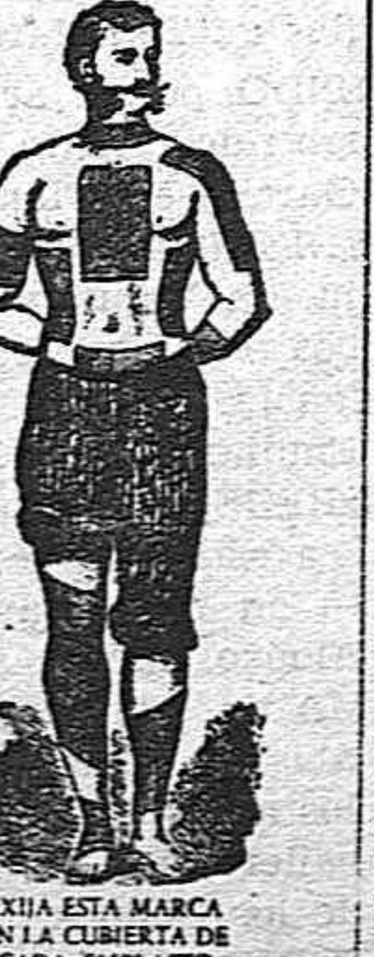
EXIJA ESTA MARCA EN LA CUBIERTA DE CADA EMPLASTO