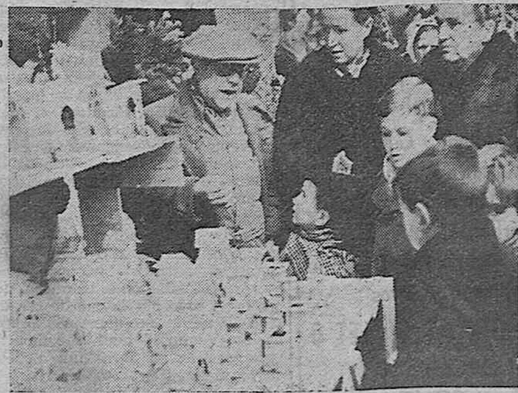
Exhibición de nacimientos en la plaza de Santa Cruz de Madrid

Próximamente se pondrá a la venta el CALENDARIO de la Sección Femenina para 1940.