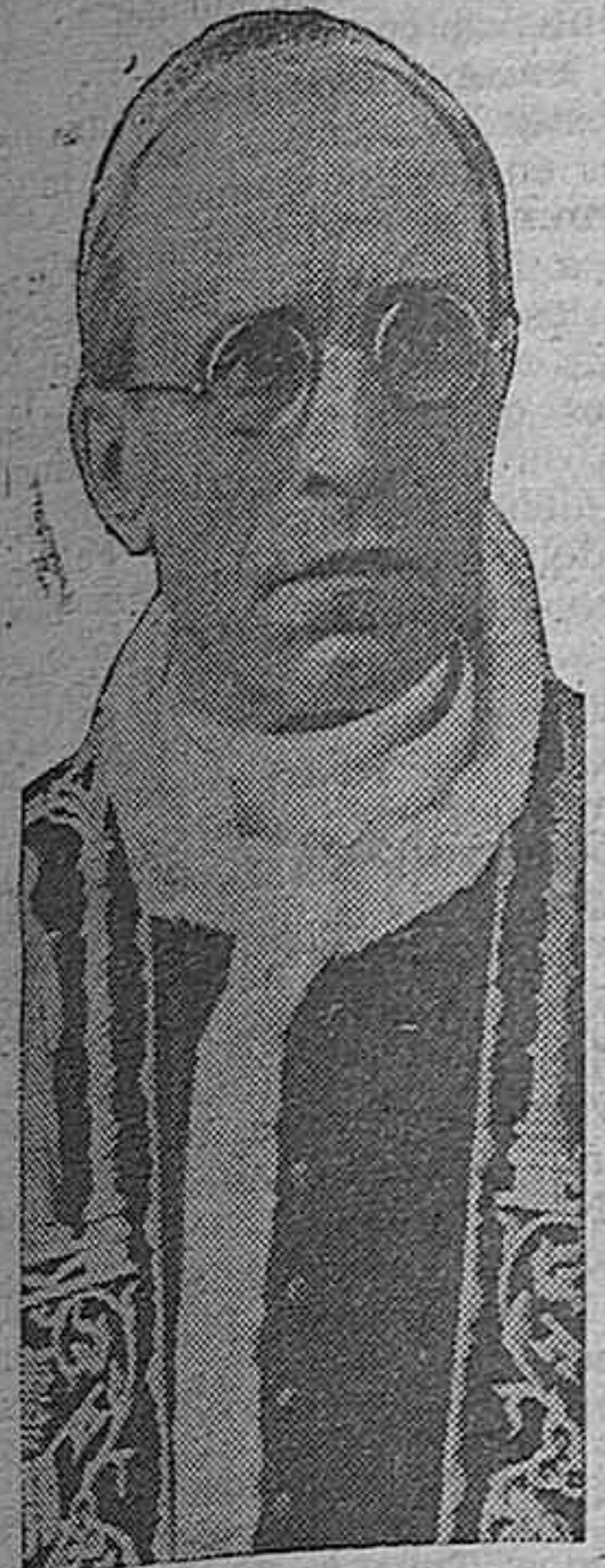
PIO XII Y LA PAZ

Ciudad del Vaticano.—Su Santidad el Papa pronunció el domingo ante el Sacro Colegio Romano, un discurso, en el que condenó la agresión de Finlandia por la URSS e indicó las bases sobre las cuales debe restablecerse la paz.