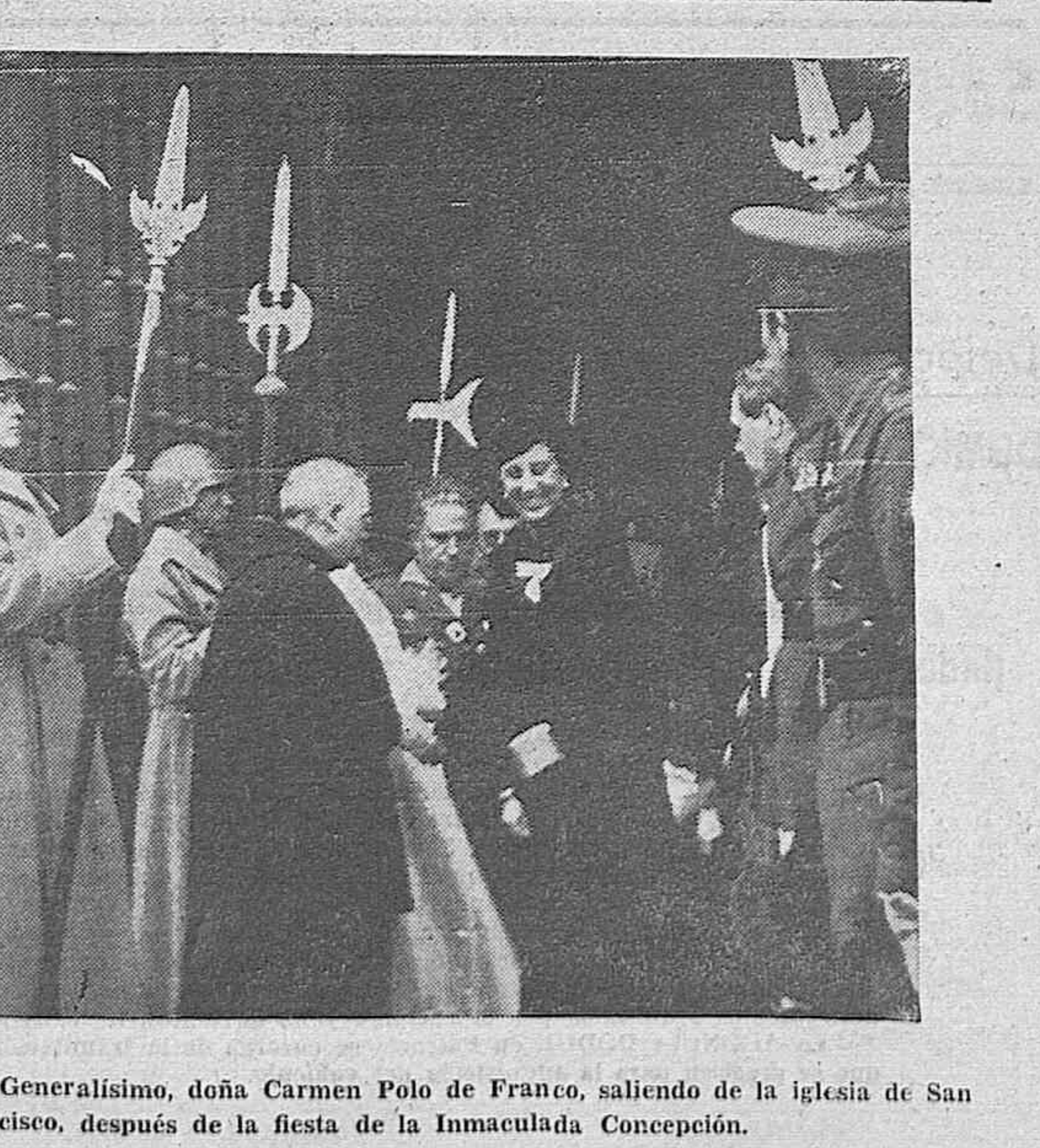
MADRID.—La esposa del Generalísimo, doña Carmen Polo de Franco, saliendo de la iglesia de San Francisco, después de la fiesta de la Inmaculada Concepción.