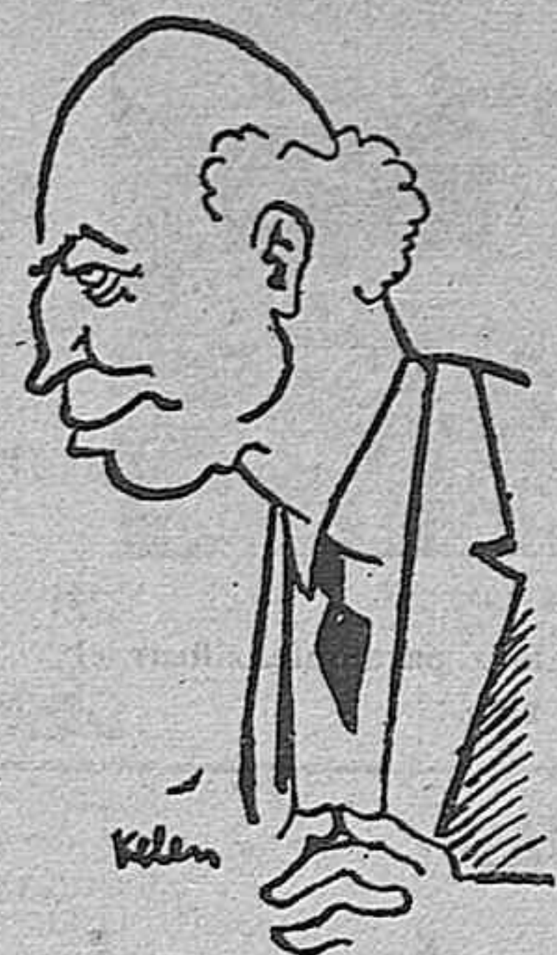
SIR JHON SIMON

EN EL BANQUETE AL NUEVO LORD MAYOR DE LONDRES