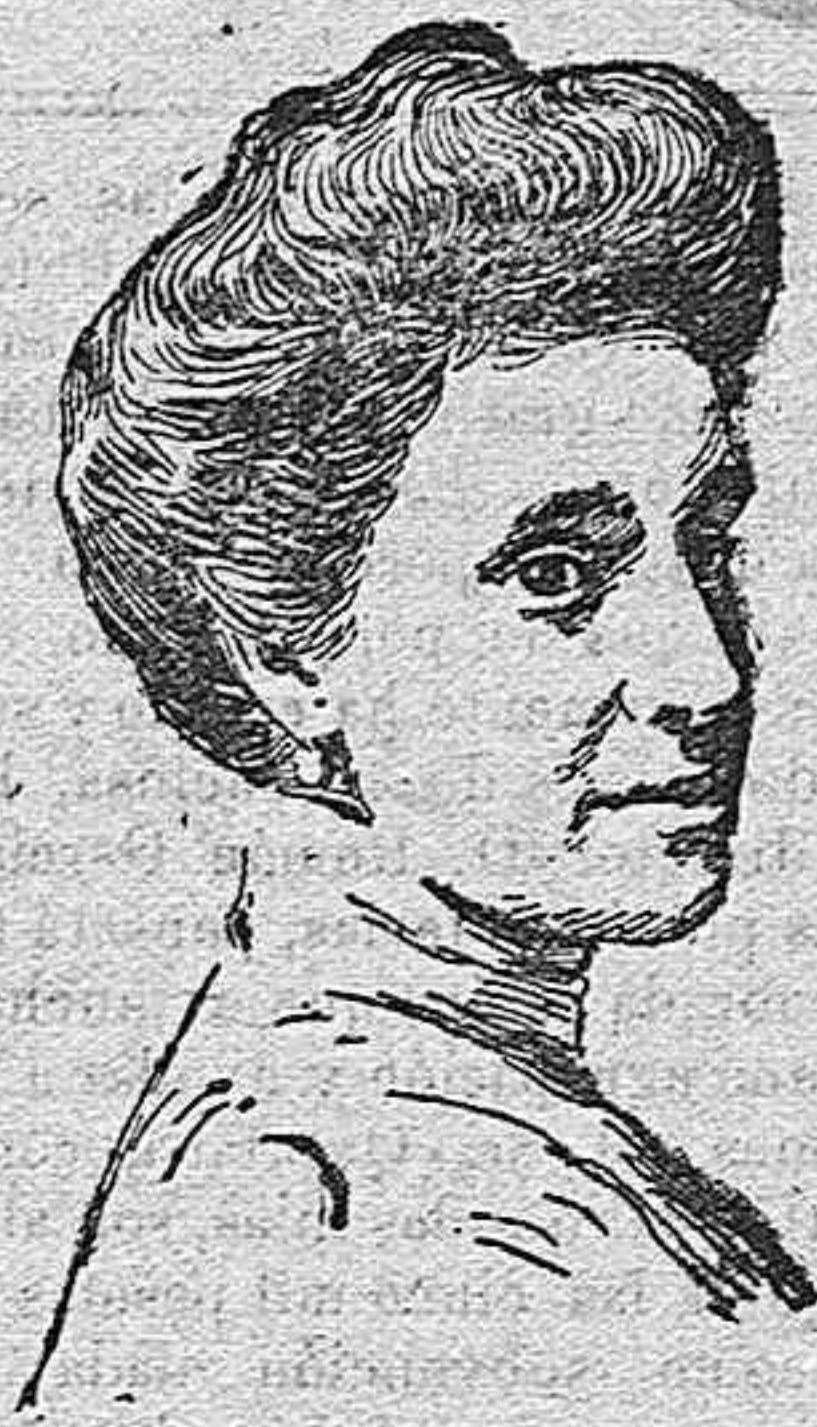
S. A. R. la infanta María Teresa, cuyo fallecimiento ha causado general sentimiento.