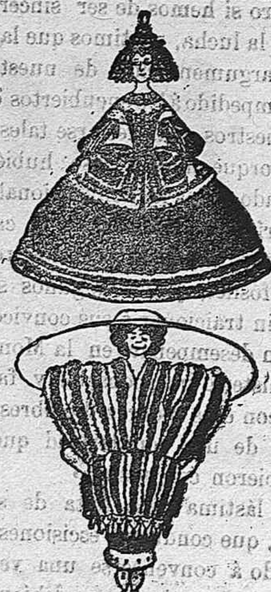
AYER Y HOY