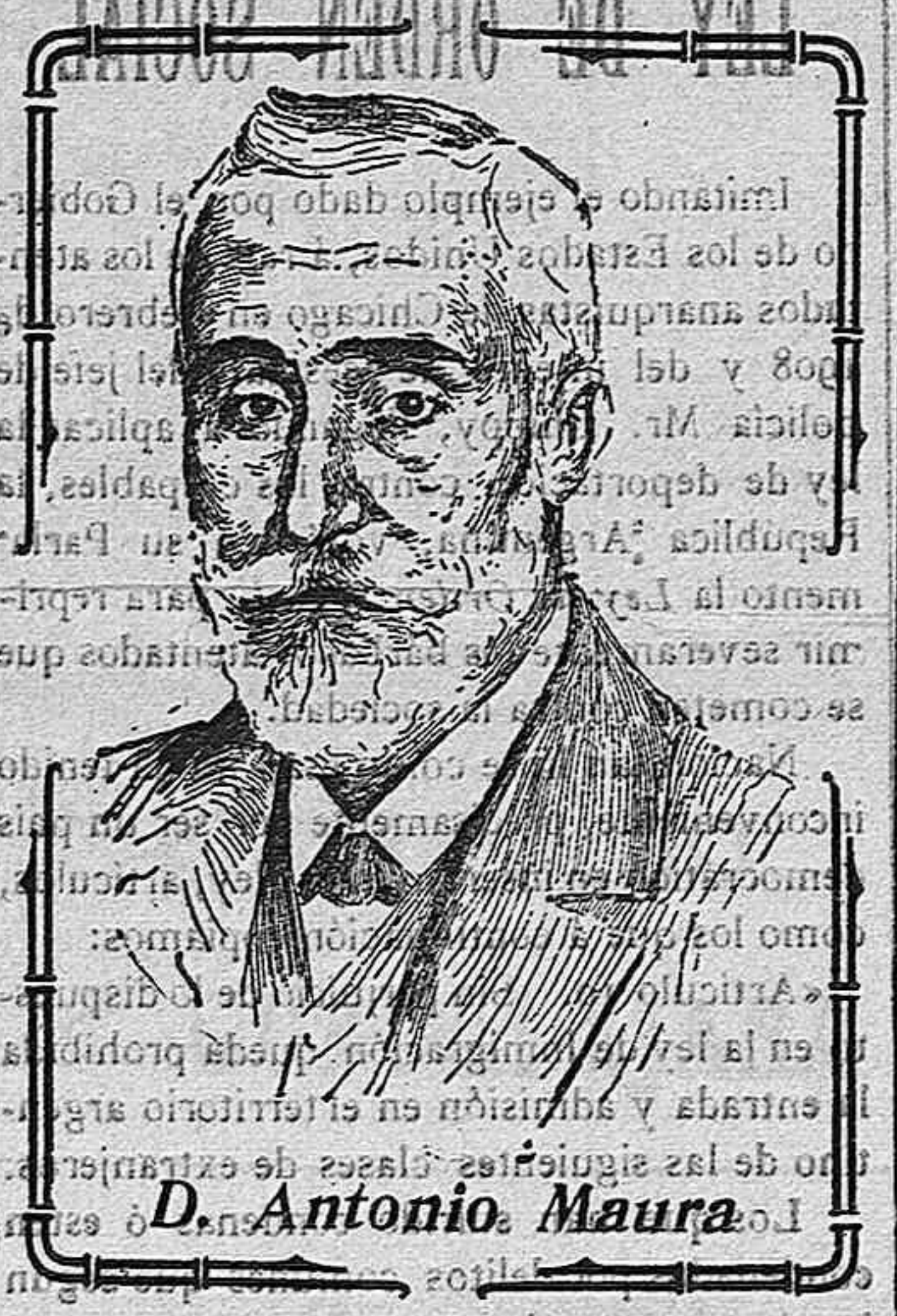
D. Antonio Maura