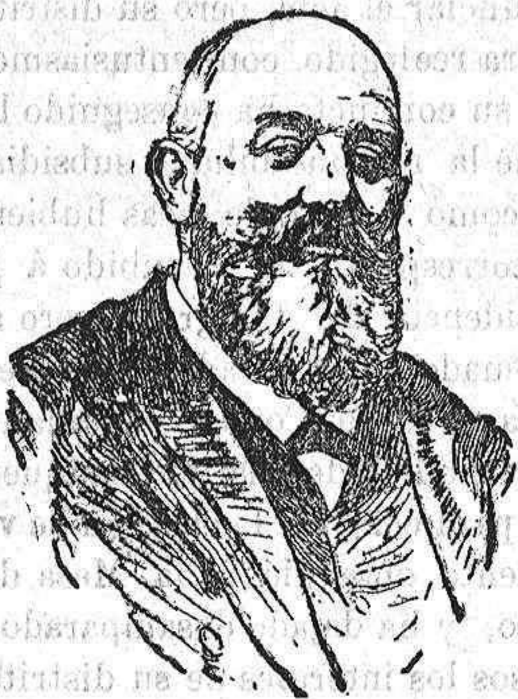
El ex ministro Sr. Barroso

Encargado del Ministerio de la Gobernación