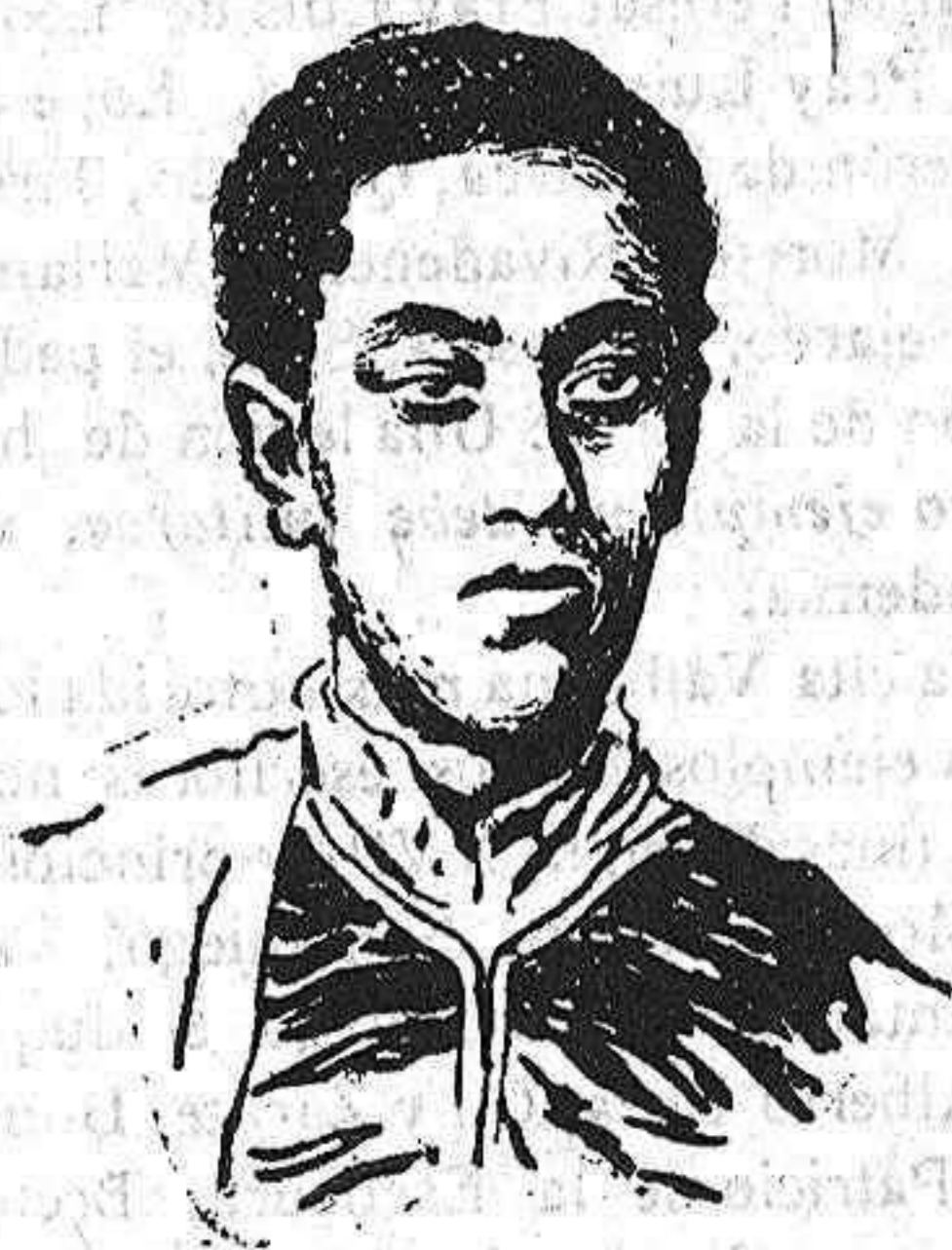
El emperador Lidj Eyasu

Noticias de Adis-Ababa, capital de Abisinia, anuncian que el príncipe Lidj Eyasu acaba de ser declarado mayor; de edad é investido de todas prerrogativas reales para la gobernación del imperio. Abisinia entra, por lo tanto, en una nueva etapa de la tan laboriosa crisis de sucesión, iniciada hace dos años por la inhabilitación física del emperador Menelik. ¡Triste destino el de este soberano, todo bondad y sabiduría, que habiendo saboreado todas las alegrías del triunfo y de la felicidad, se ve obligado hoy á seguir desde el lecho en que yace postrado, las más desastadas intrigas alrededor de su trono vacilante, sin poder acudir en socorro de este.