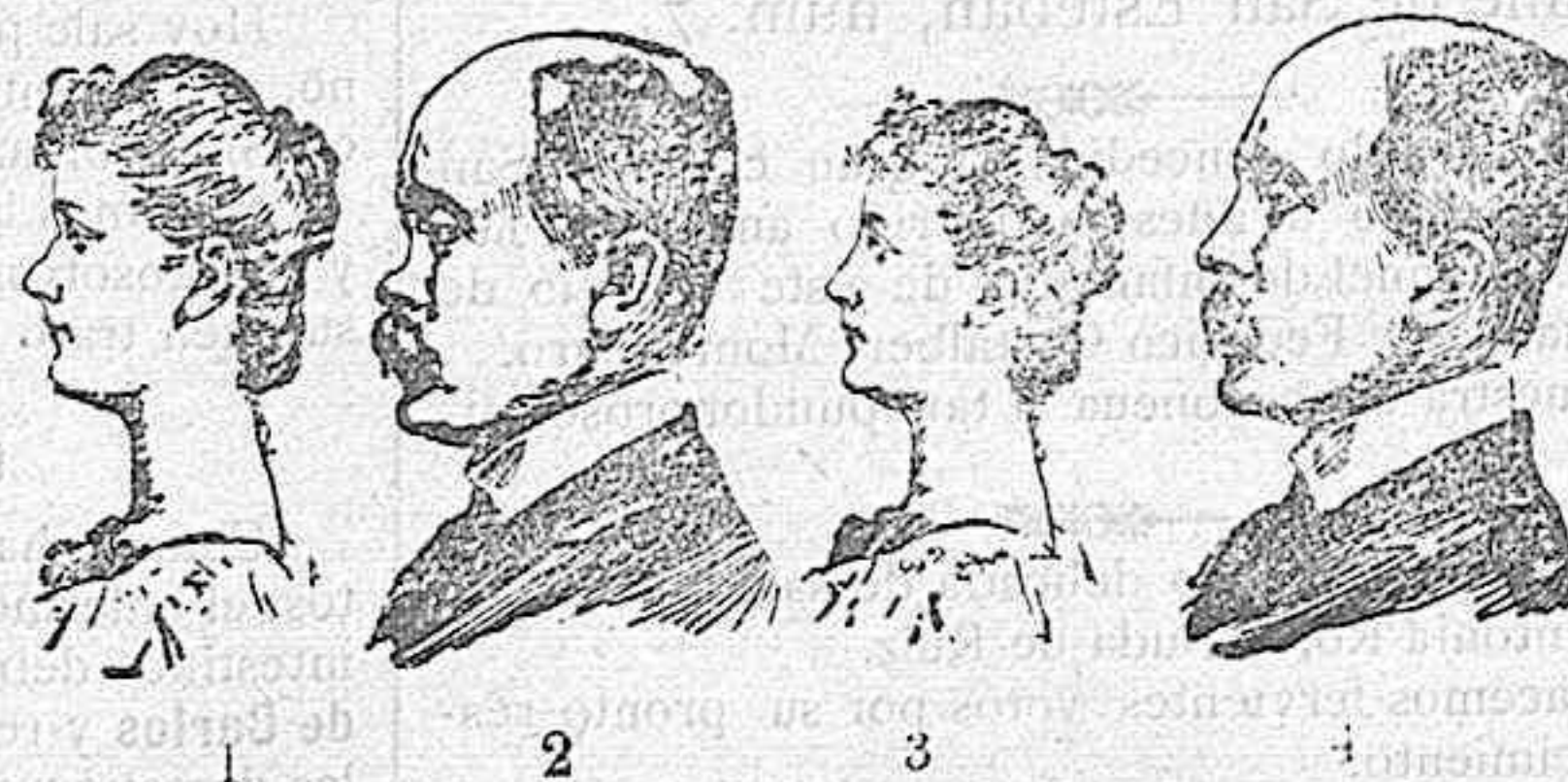
Retratos á que nos referimos en la sección de noticias de los enfermos operados por el Dr. Gallego en el Hospital de Madrid, San Bernardo, 18, duplicado.

SE VENDE una máquina de coser casi nueva muy barata. Razón Bardales, 11, bajo.