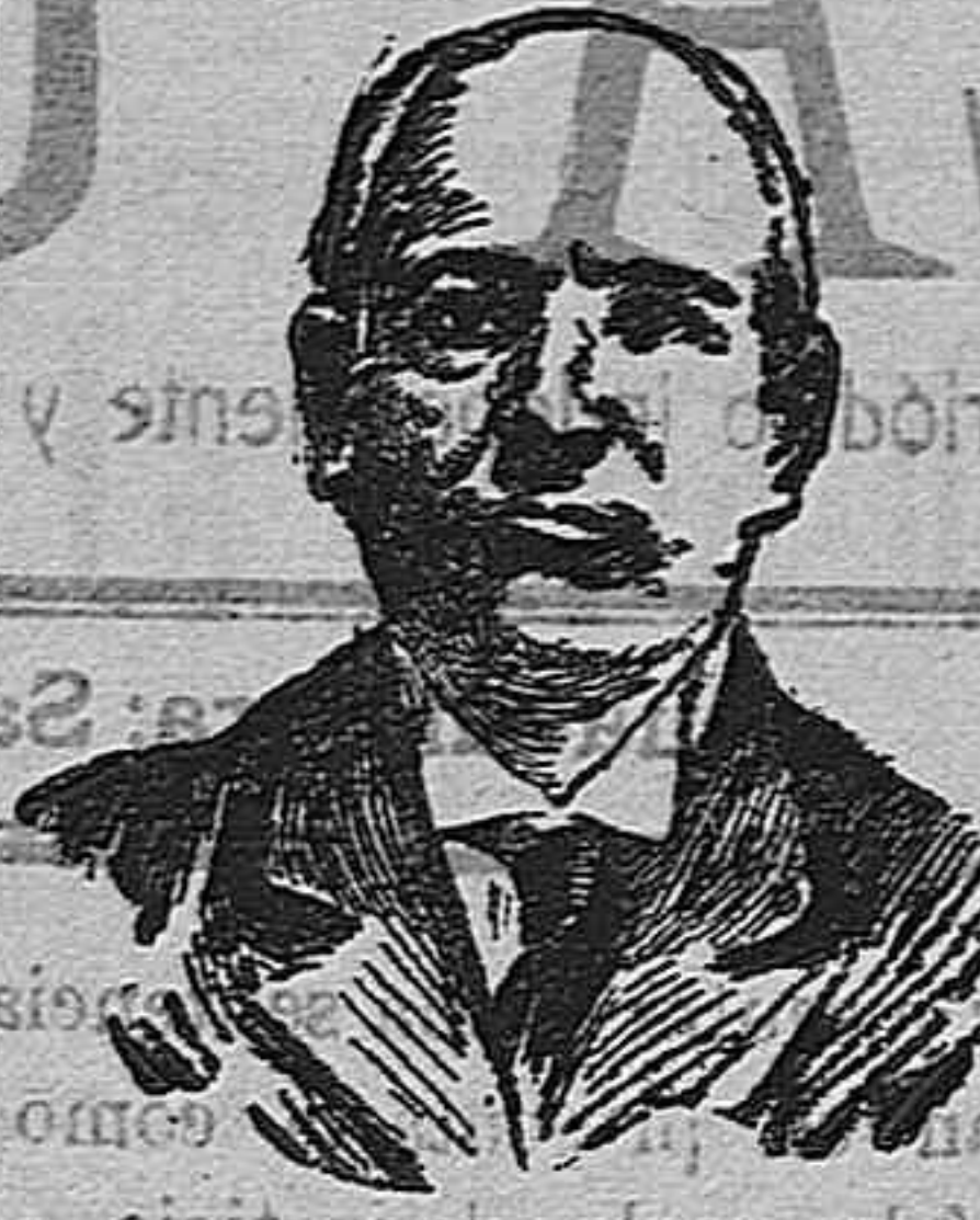
Ultimo retrato de Francisco Ferrer