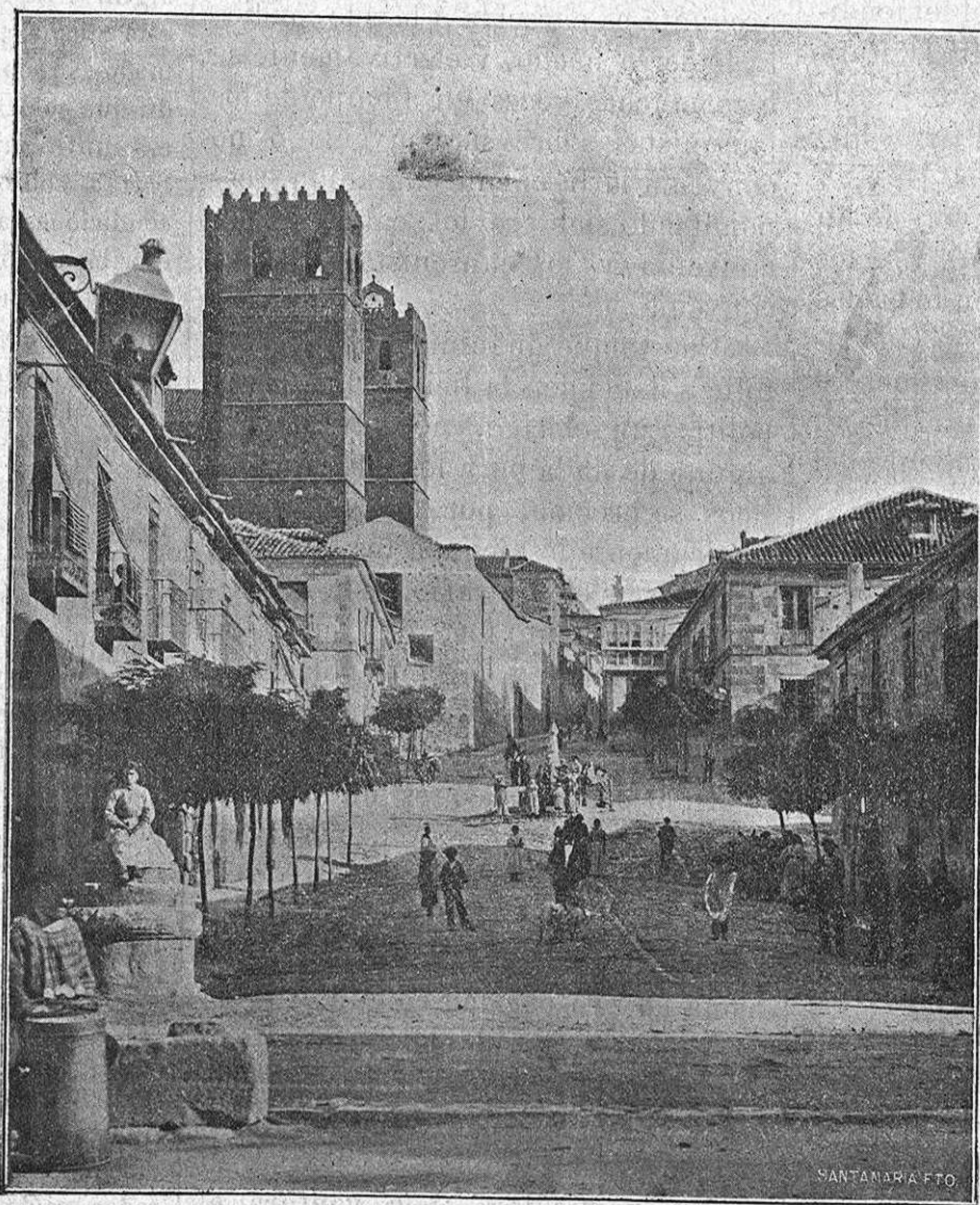
Sigüenza.—Calle de Medina, vista desde la Alameda