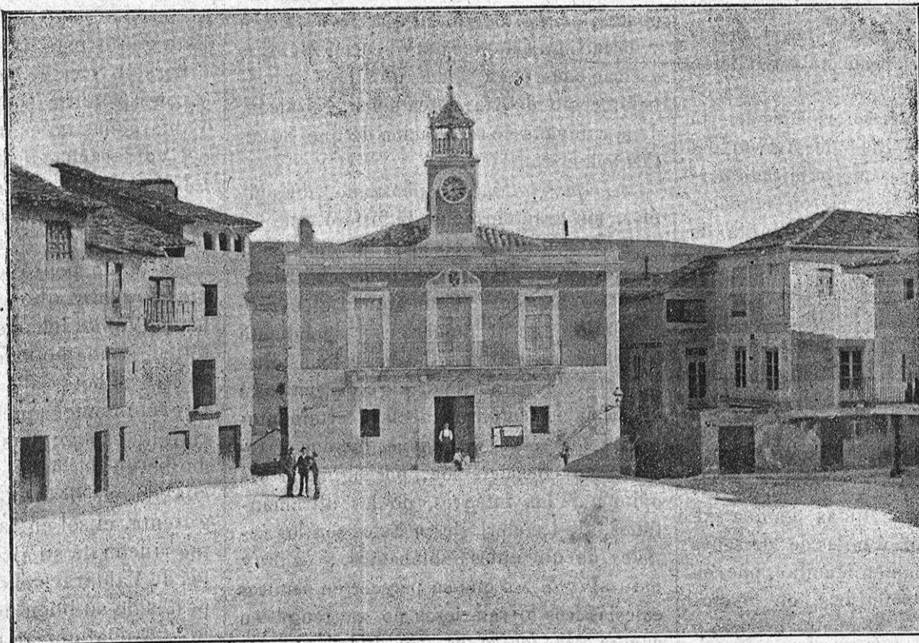
BRIHUEGA.—Casa del Ayuntamiento