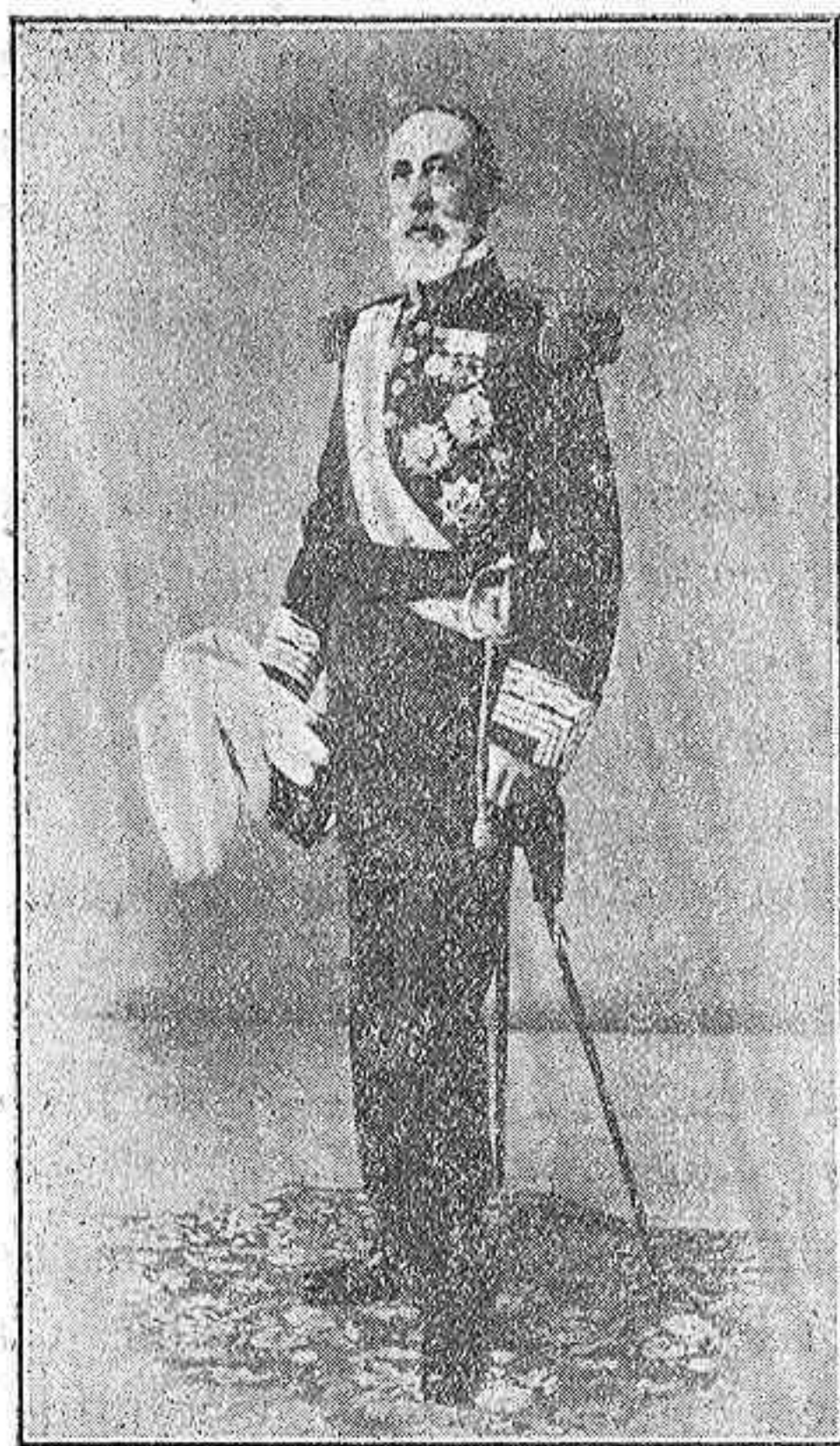
El General Teruel.