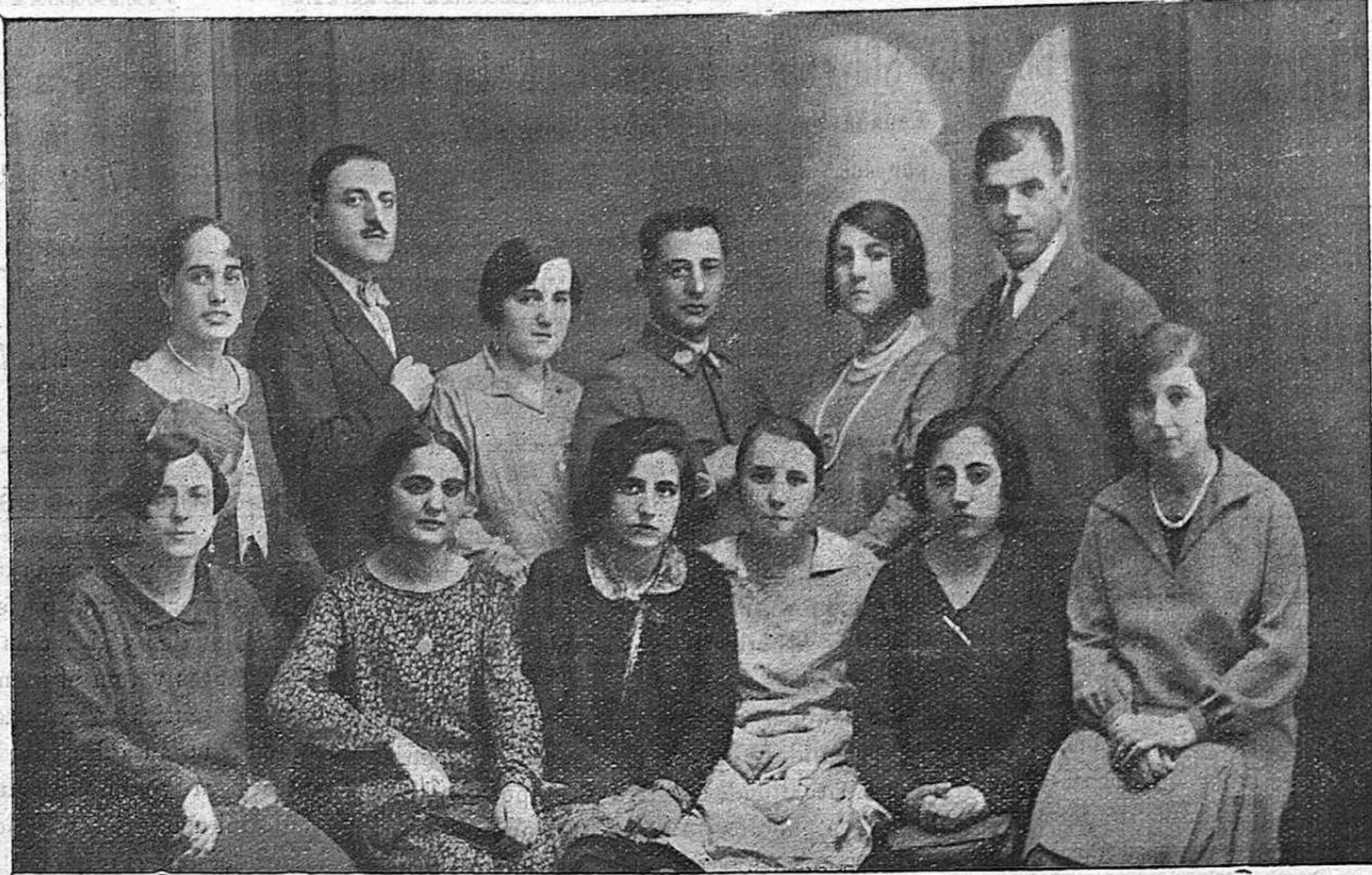
Organizadores y bellas señoritas que tomaron parte en la cuestación pública a beneficio de los damnificados en las últimas catástrofes.

artificiosos, ambiciones, habilidades, promesas sin garantía, amenazas perturbadoras. Esa España que tiene tal designio la formamos todos los españoles de buena voluntad, que después de sufrir las torturas de tantos desastres y torpezas del pasado, hemos podido comprobar en las bienandanzas del presente, que proseguir éste equivale a labrar la decorosa herencia que de nuestras manos deben recibir las generaciones futuras.