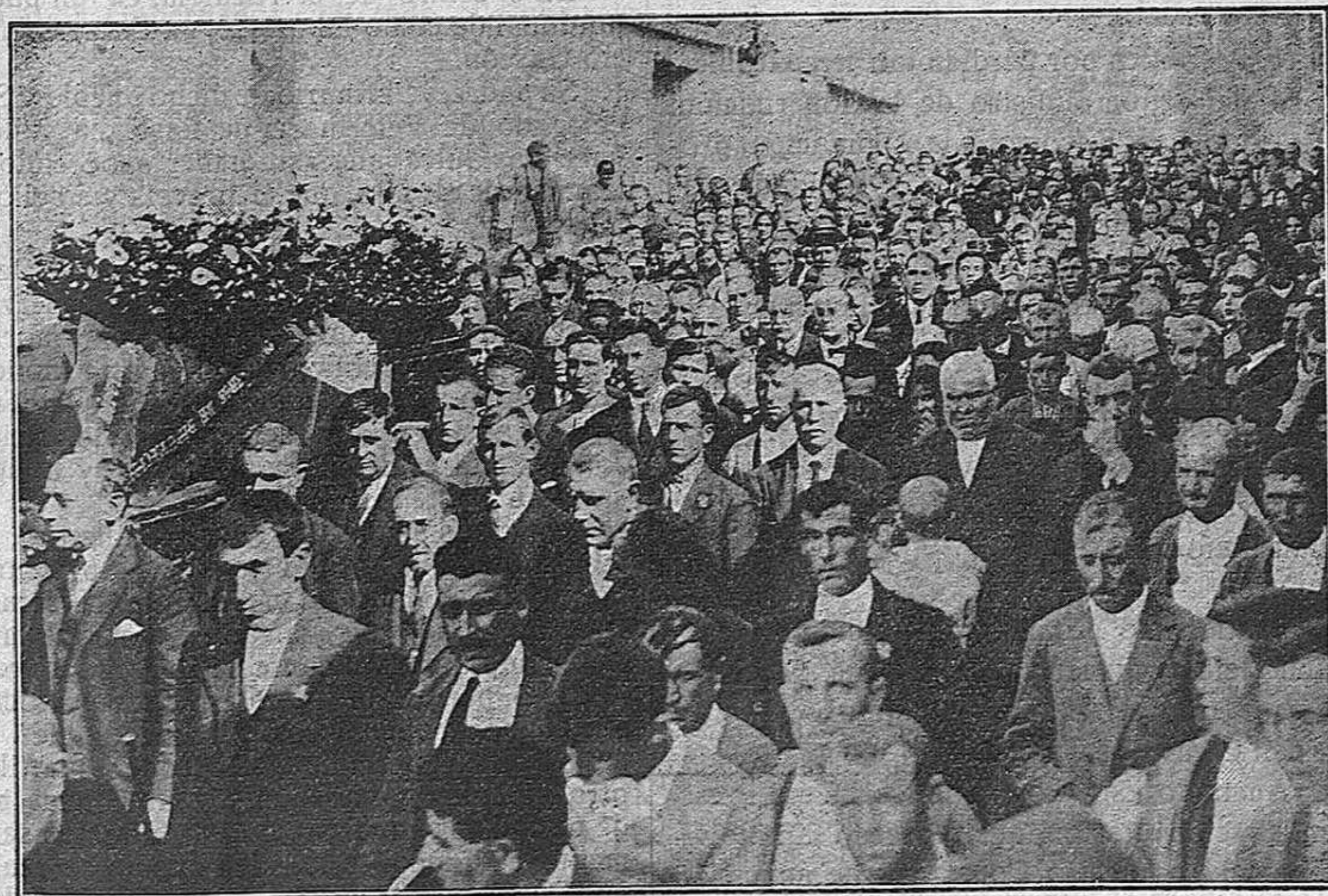
ESCARICHE.—La conducción del cadáver seguido de enorme gentío.