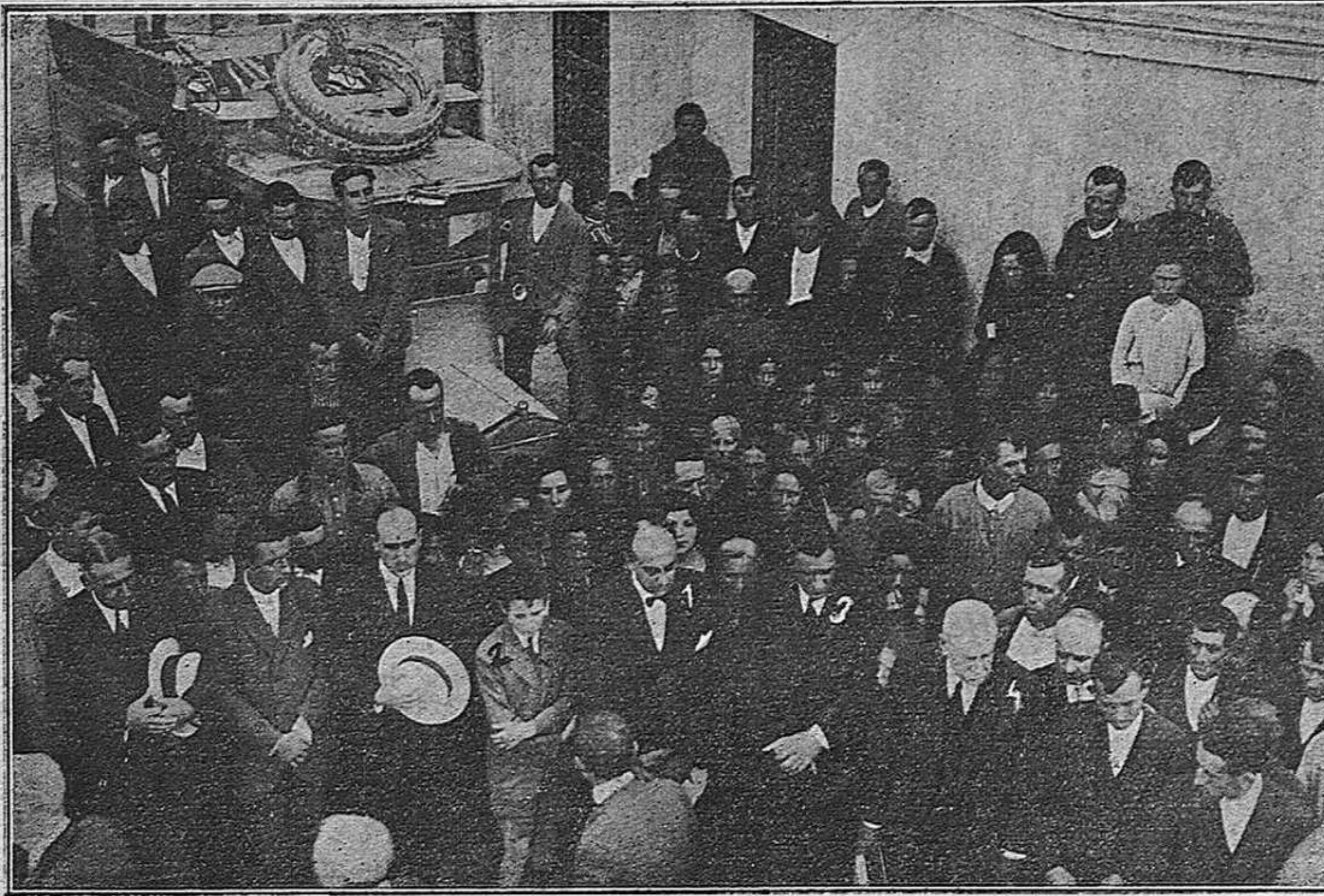
ESCARICHE.—Despidiendo el duelo: (1) el Gobernador civil; (2) el hijo del finado; (3) el Delegado de Hacienda; (4) el Alcalde de Guadalajara.....