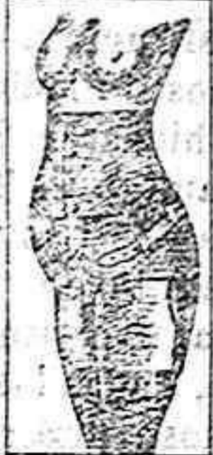
CORSET - PRECISION

Armas de fuego - Ferretería - Cementos - Tuberías Camas de Hierro y Madera - Sillas - Cristales Herrajes para obras - Material eléctrico - Etc.