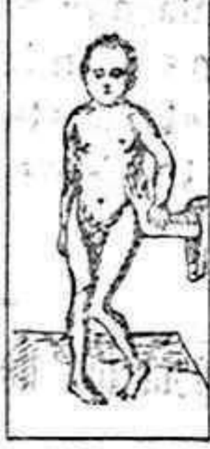
ENFERMEDAD DE LITTE