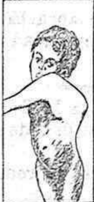
MAL DE POTT - RIGIDIDAD