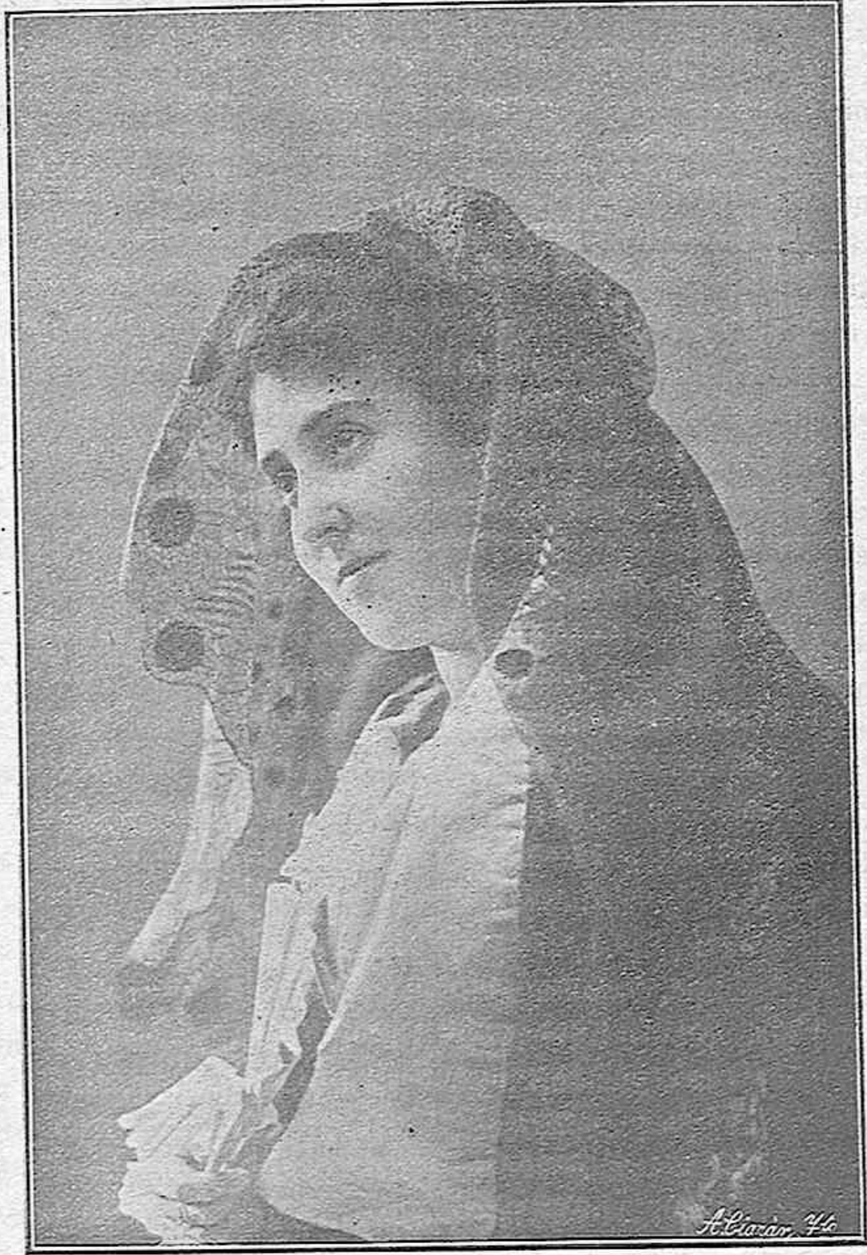
Pepita Sanz, eminente tiple de ópera, que ha alcanzado un triunfo más en un concierto celebrado en su honor en la casa de los Sres. de Villegas, en Madrid.

Nuestro Gobernador civil, en unión de otras distinguidas personas, nos dan, con su loable conducta, un hermoso ejemplo que hay que imitar.