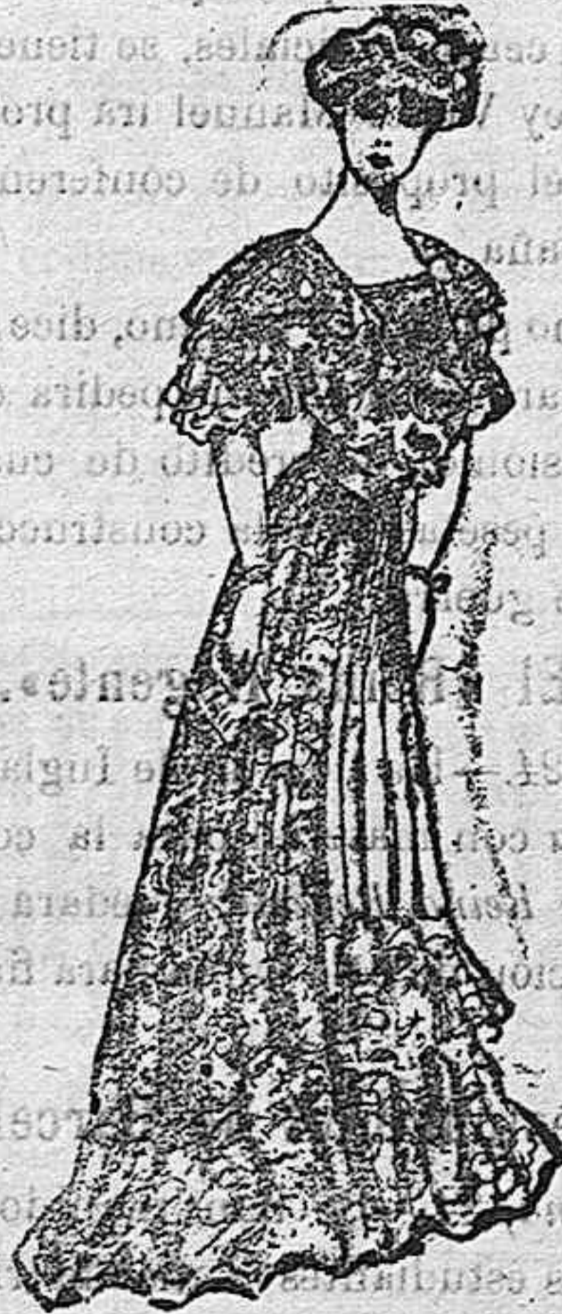
Traje para reuniones.

De raso, color violeta, completamente bordado. Cuerpo blusa con manga corta formando volante. Gran descote y pecherín de seda, también bordado. Faja de seda del mismo color del traje. Falda lisa en el delantero, con dos volantes de bordado en el bajo.