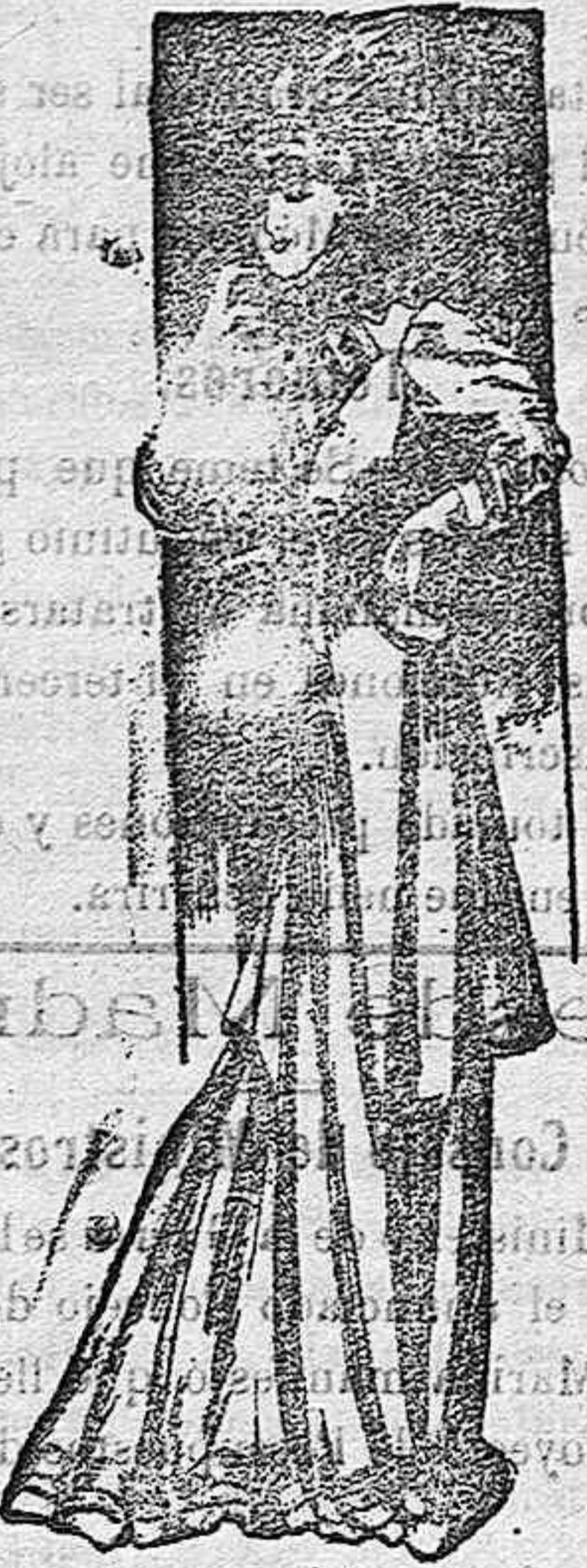
Traje para noche.

De raso, color violeta, completamente bordado. Cuerpo blusa con manga corta formando volante. Gran descote y pecherín de seda, también bordado. Faja de seda del mismo color del traje. Falda lisa en el delantero, con dos volantes de bordado en el bajo.