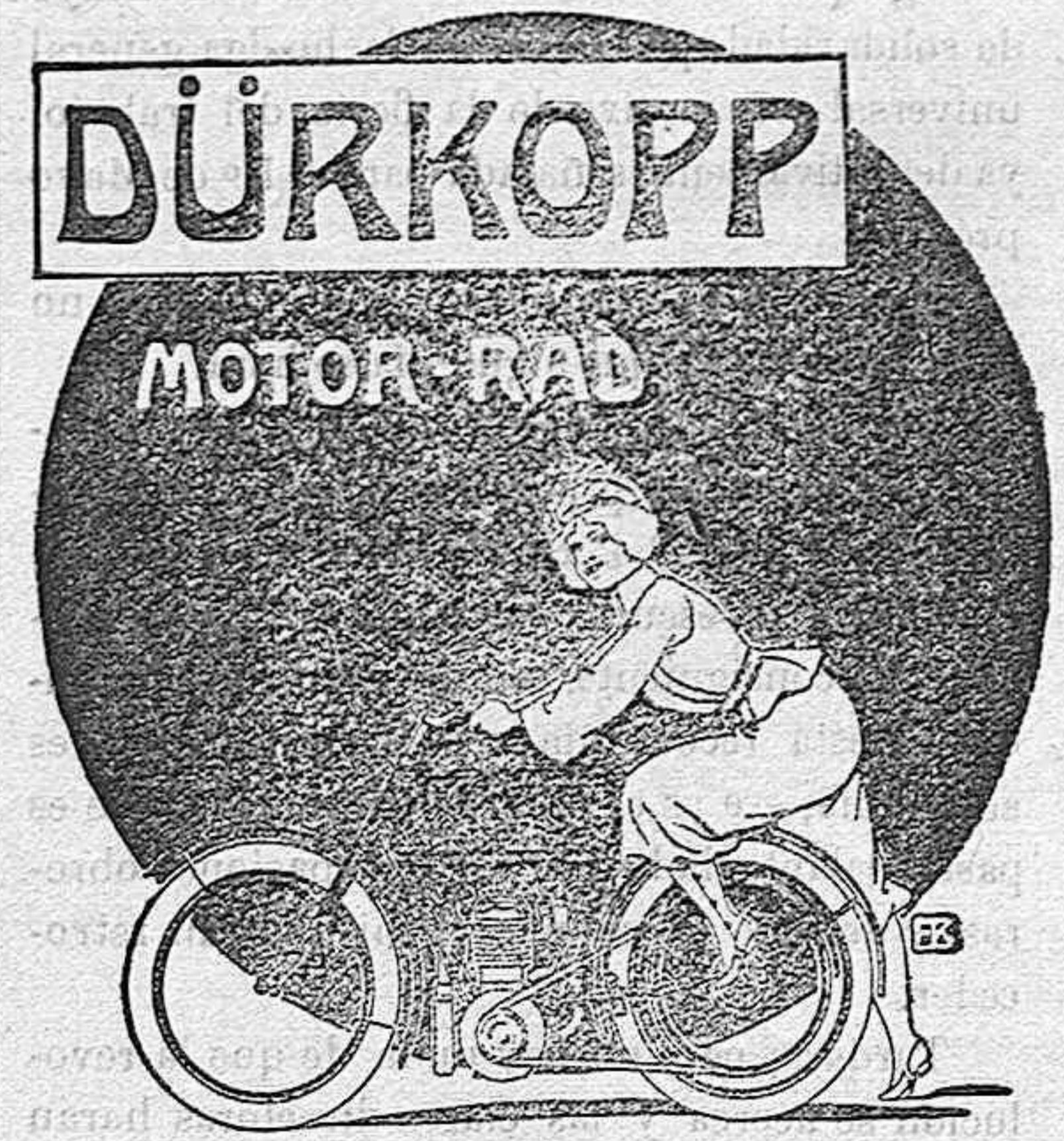
DÜRKOPP & C.º. A. G. BIELEFELD.

GARANTIZAMOS de igual modo una suavidad extraordinaria en los rozamientos de estos nuevos juegos, mediante los que se obtiene la más ligera marcha y la mayor facilidad para subir las cuestas. Infinidad de testimonios á disposición de nuestros favorecedores. Pidense catálogos de Bicicletas, Motocicletas, Automóviles y de accesorios en español, mediante la remisión de franqueo á la DELEGACIÓN GENERAL PARA ESPAÑA Y PORTUGAL: OTTO STREITBERGER, Apartado de Correos 335, Barcelona.