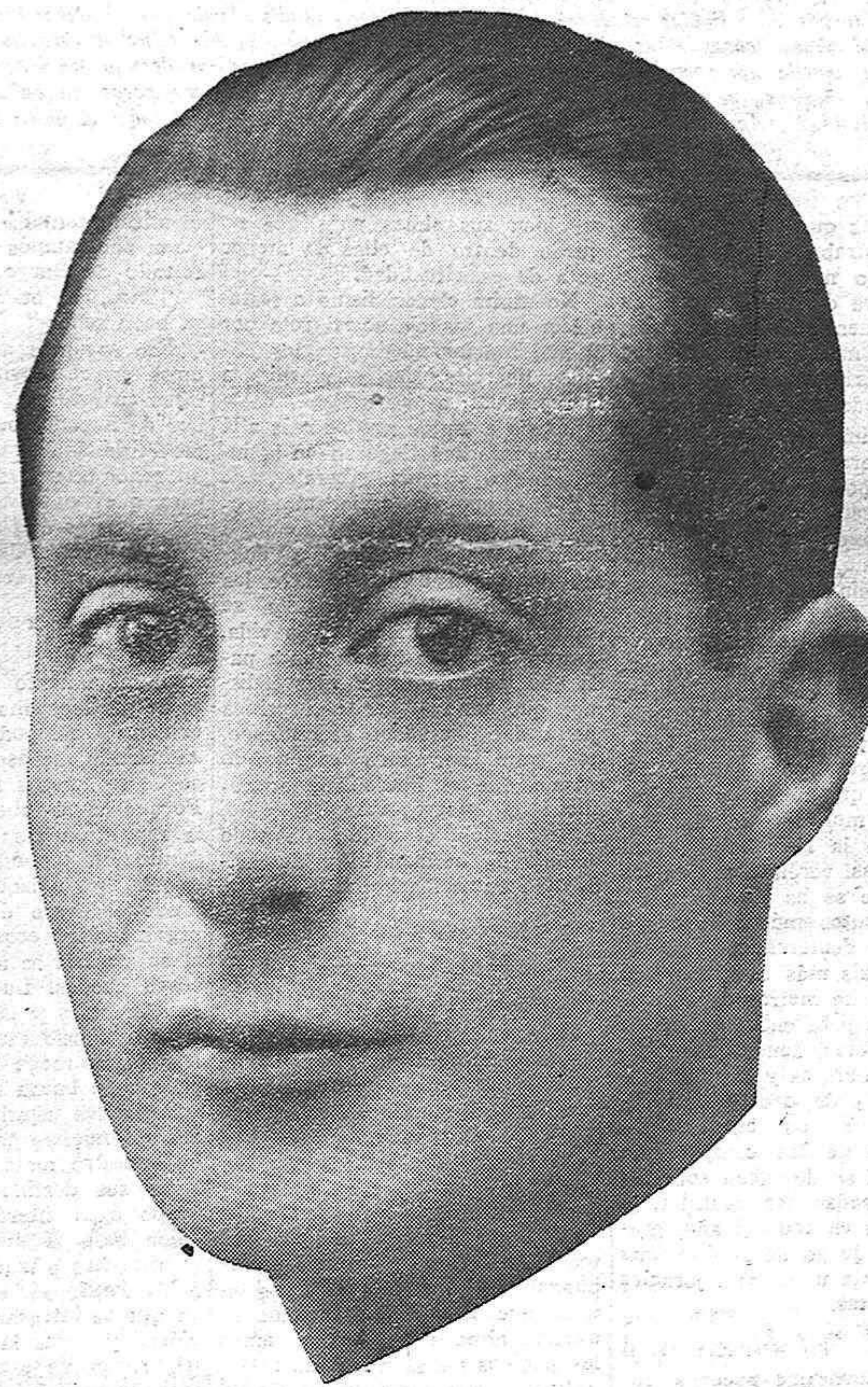
José Antonio, encarnación de la Falange, voz fértil que rompió el silencio estéril de la tradición histórica y que con sus conceptos marcó la ruta imperial a España. En este día de lutos azules tenemos el pensamiento fijo en ti y en aquellas gloriosas palabras de octubre que tanto nos enseñaron

La inactividad es absoluta a causa del mal tiempo en todos los sectores. El Gállego ha aumentado de cauce inundando las carreteras y caminos; ya no intentan atacar. Tal ha sido la desmoralización, ni han tratado ya desalojarnos de nuestras posiciones. Han tocado el más rotundo fracaso.