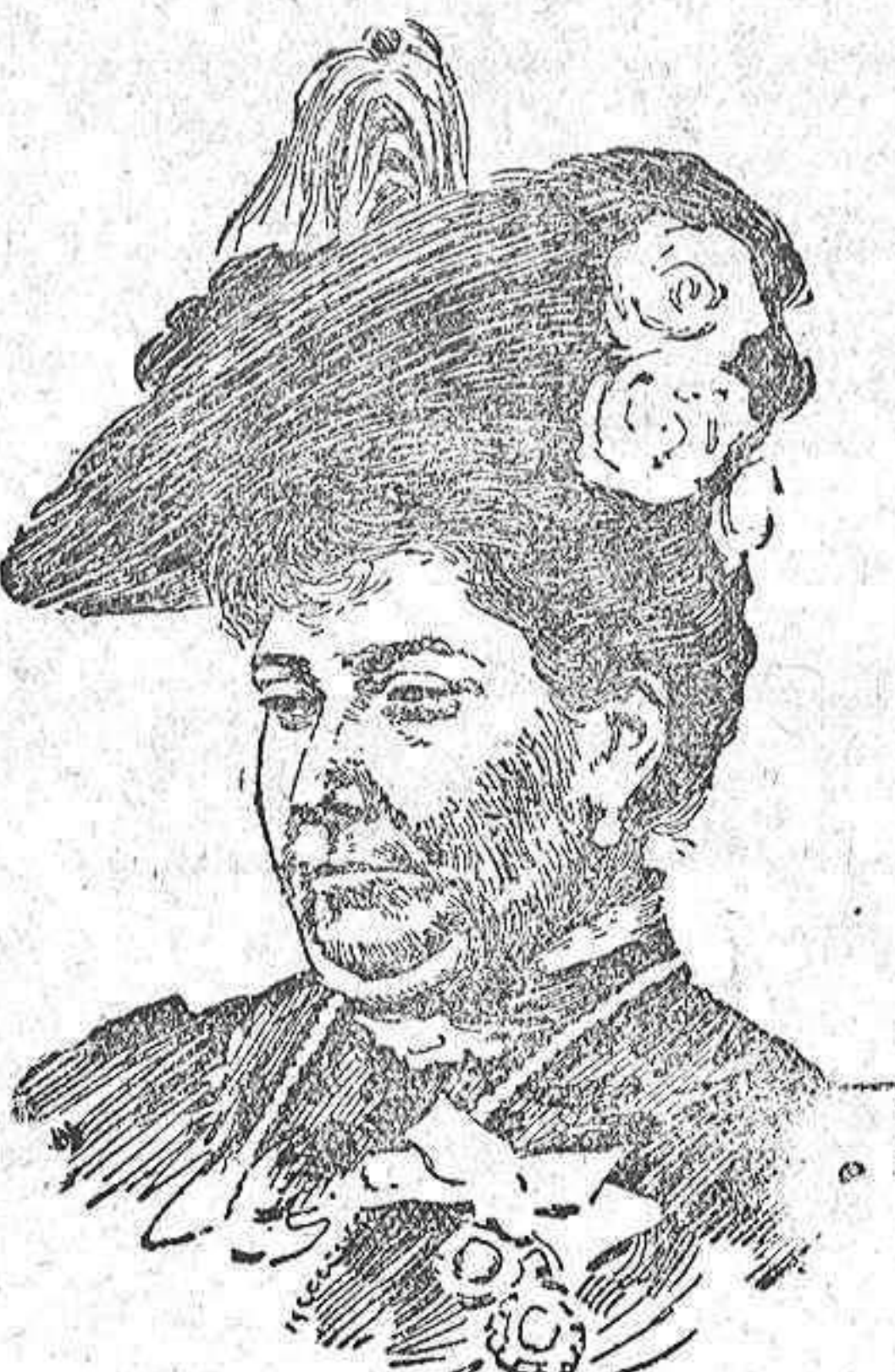
La princesa doña Beatriz de Battenberg madre de la reina Victoria, que ha llegado a Madrid, donde pasará una temporada al lado de su hija.