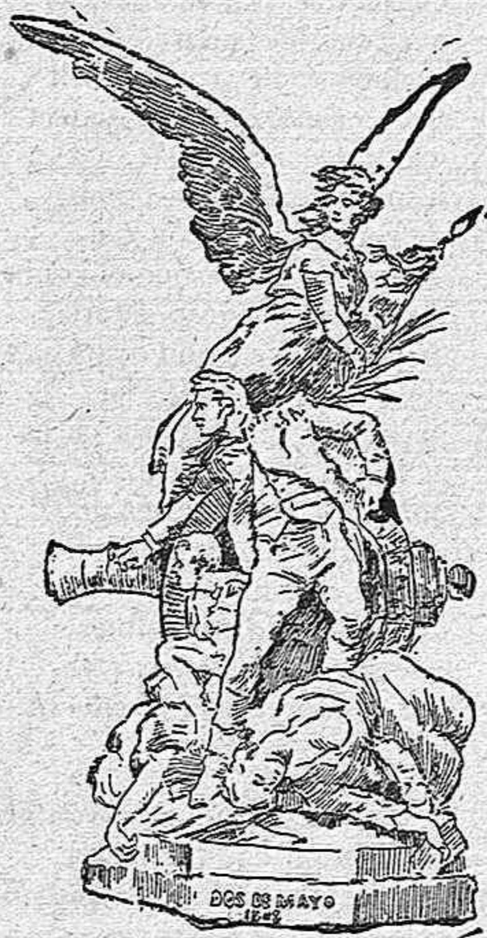
A los héroes del 2 de Mayo de 1808.

El pueblo de Madrid era deudor á los héroes del 2 de Mayo, de un monumento que perpetuara en mármoles y bronces su memoria, y con ella el desprecio á la vida de que hicieron patriótico alarde en el memorable día. En la plaza de la Lealtad se eleva gallardo y esbelto obelisco de dorada piedra, y en la entrada de la Moncloa hay un grupo escultórico que recuerda uno de los episodios de aquella fecha, es cierto, pero el primero es un monumento