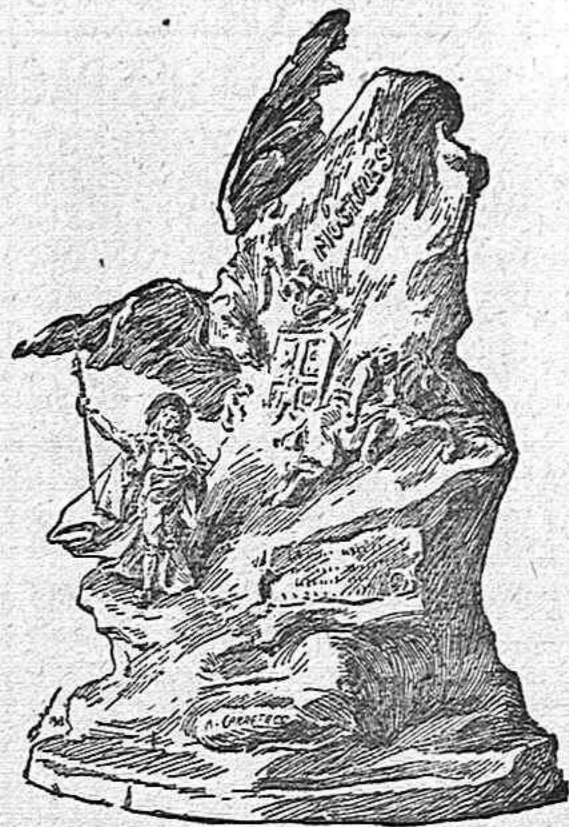
Al alcalde de Móstoles.

El día 2 de Mayo es el señalado para la inauguración del monumento erigido en Móstoles á D. Andrés Torrejón, aquel famoso Alcalde, que al tener noticia de la invasión francesa, con arrogancia y energía dignas de los que pelearon contra las huestes napoleónicas en la gloriosa epopeya de la Independencia,