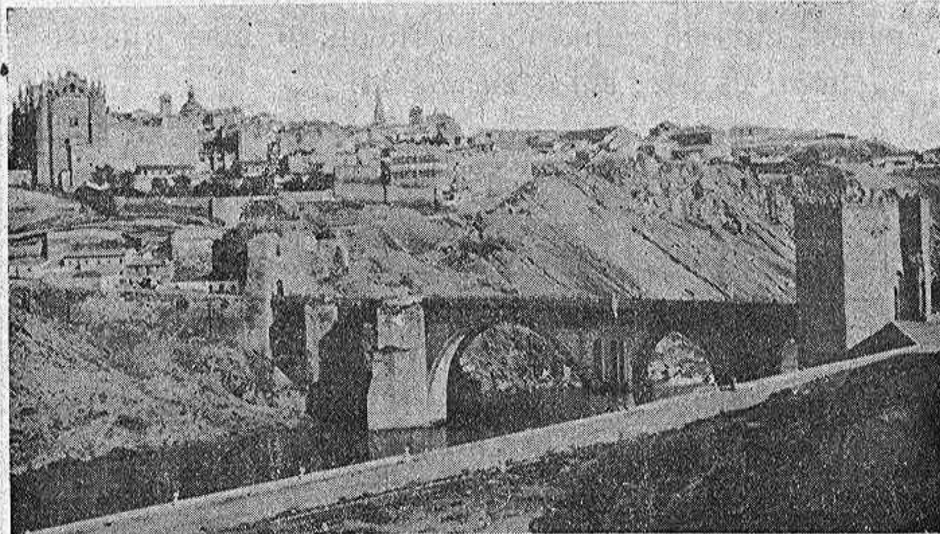
EL DE SAN MARTÍN

reparaciones, no he de discutirla. La vecindad, con la Academia de Infantería, desaparecería, no utilizando la parte que da á la cuesta del Carmen, y los peligros por lo céntrico del sitio también pensaban hacerlos desaparecer haciendo la entrada del establecimiento benéfico en sitio y orientación convenientes.