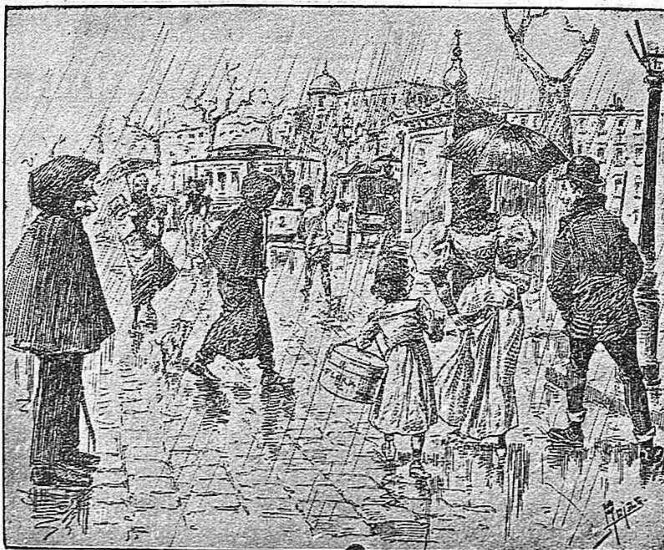
Dibujo a pluma de Rojas.