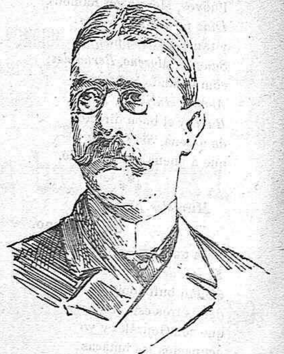
BARÓN DE GAUSTSCH, Presidente del Consejo de Ministros