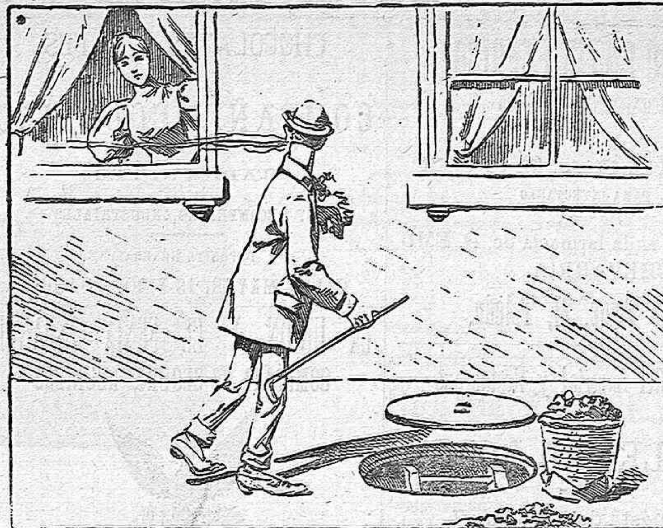
—Yo te amaría.