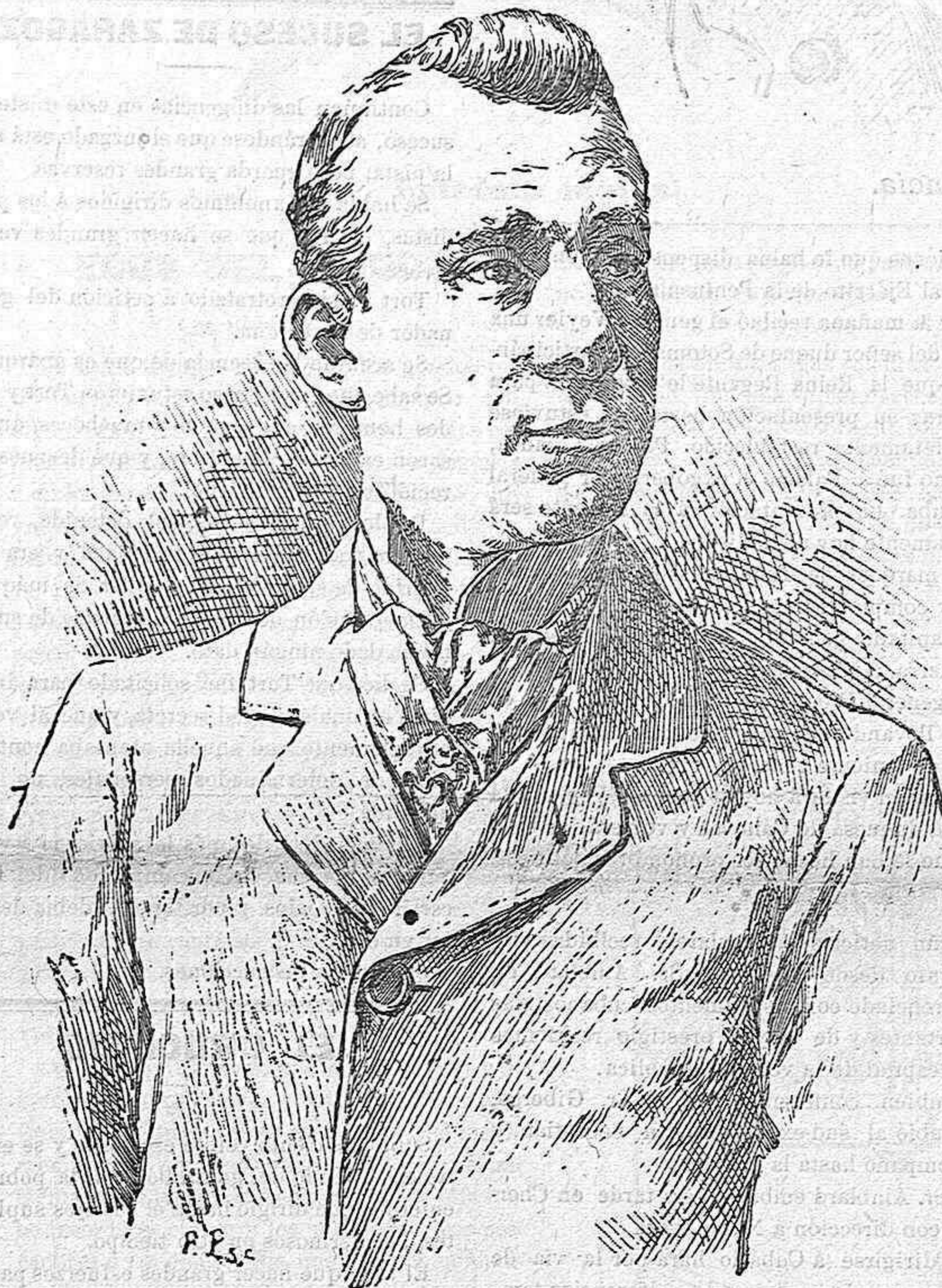
FERNANDO DÍAZ DE MENDOZA

Es el más aristocrático de nuestros actores.