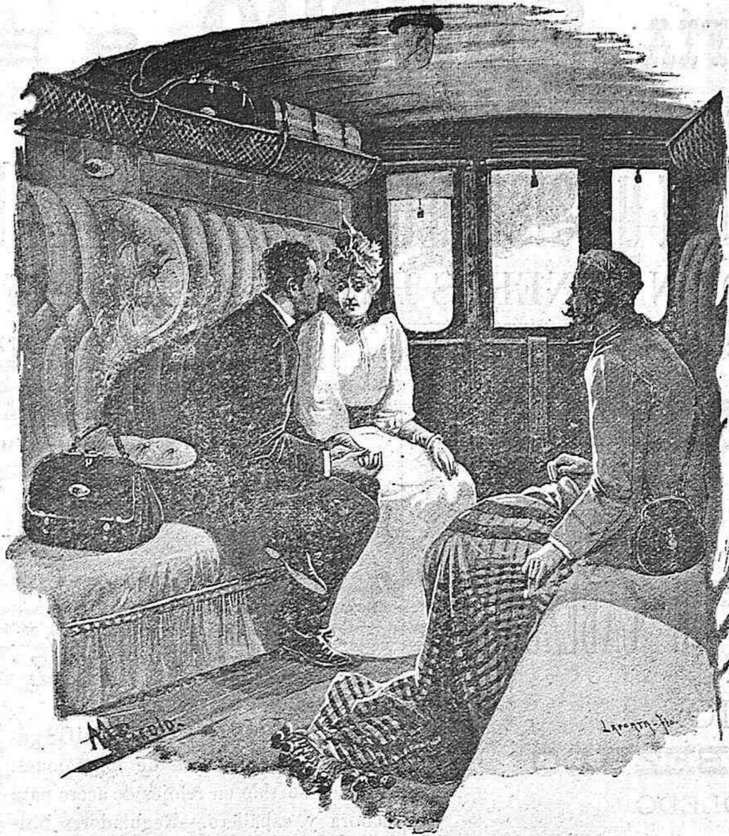
DE VIAJE (Dibujo de M. Pícolo).

Entonces él se aproximó más á Marinón y,