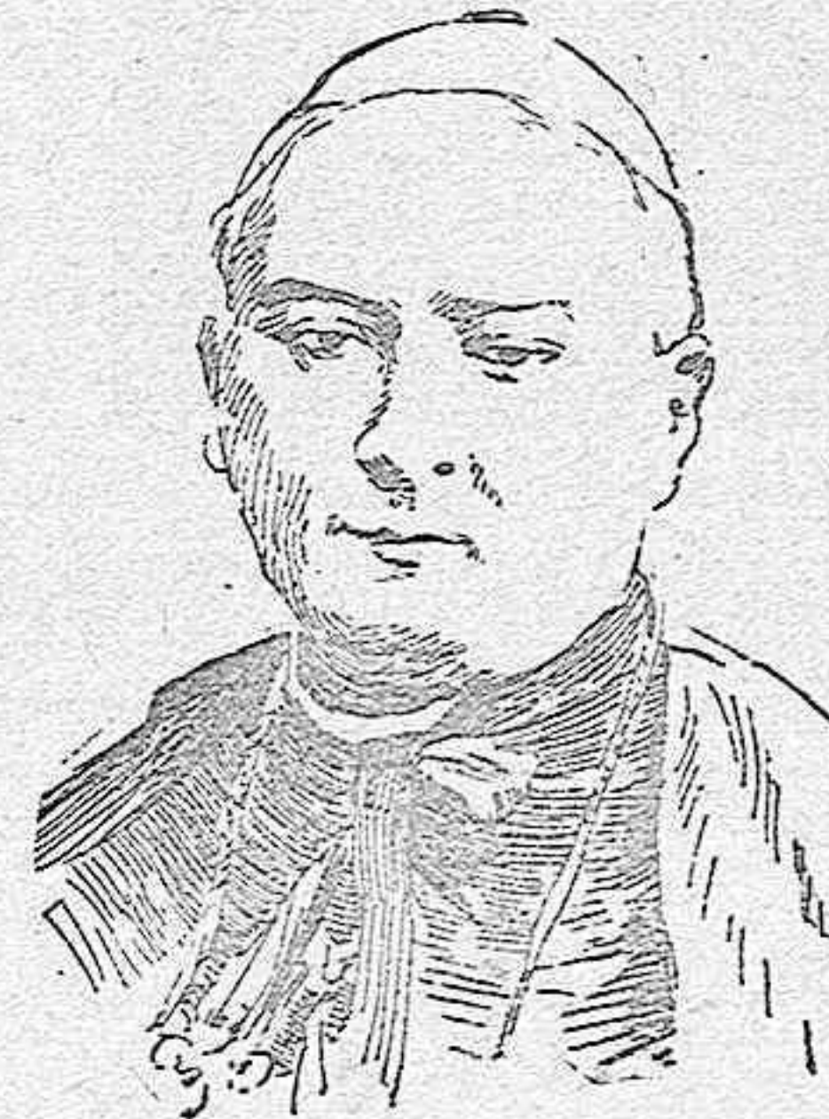
El Doctor D. Adolfo Nonel, Arzobispo de Santo Domingo, elegido Presidente de la República dominicana.