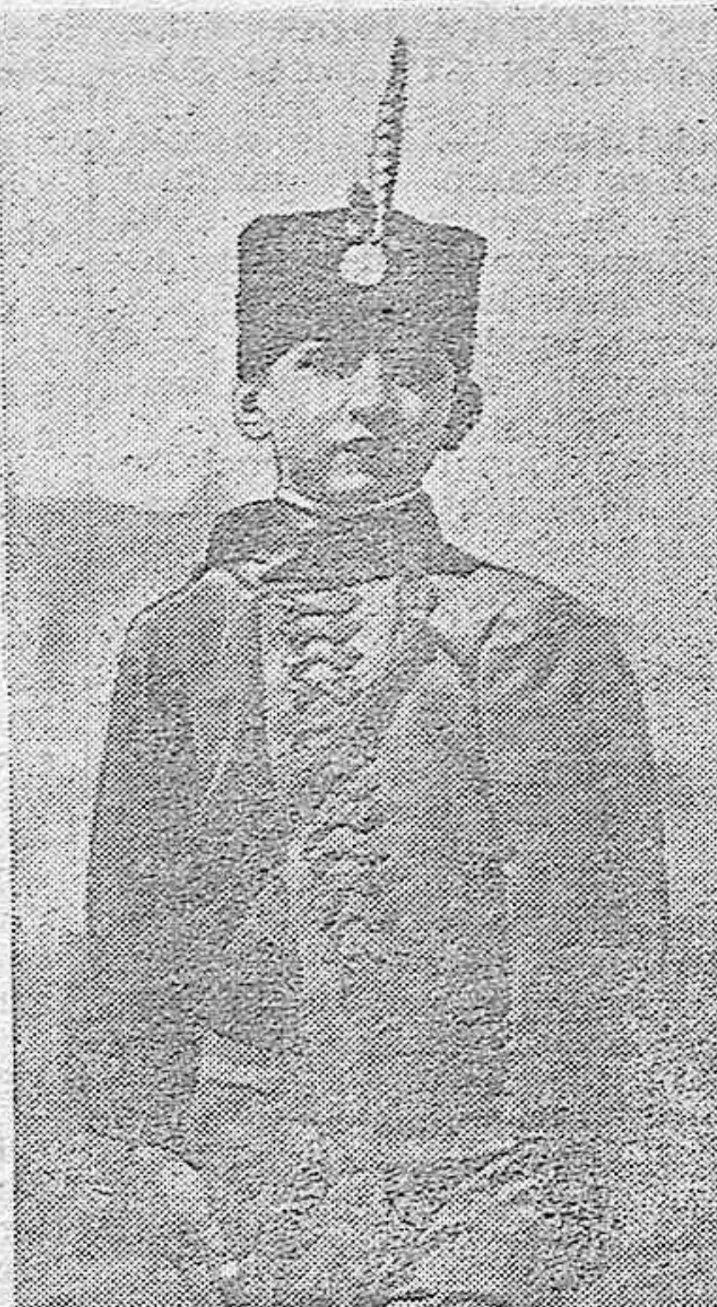
El Príncipe Pedro, que a la edad de once años, ha sido proclamado Rey de Yugoslavia, con el nombre de Pedro II.

Día 26: «Barcelona», para Hamburgo. Día 27: Un vapor, para Liverpool. Día 27: «Torfinn Jarl», para Londres. Día 27: «Alhama», para Bristol y Cardiff. Día 27: Un vapor, para Southampton. Día 28: «San Andrés», para Noruega. Día 29: «Alcira», para Glasgow. Día 29: «Caledonia», para Suecia. Día 30: «Egholm», para Copenhague.