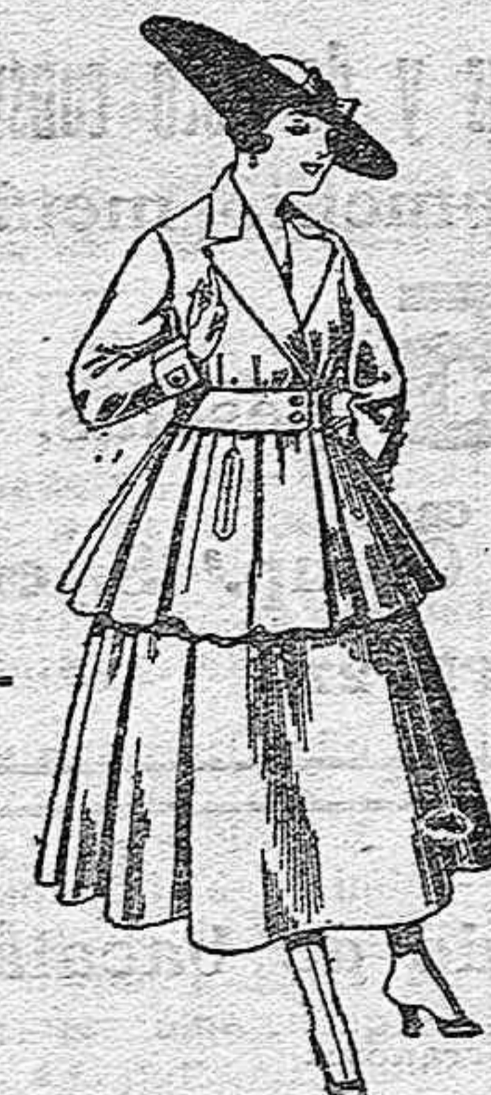
Traje de lana, en negro, azul y color, para señora, de pesetas 90 a 100.