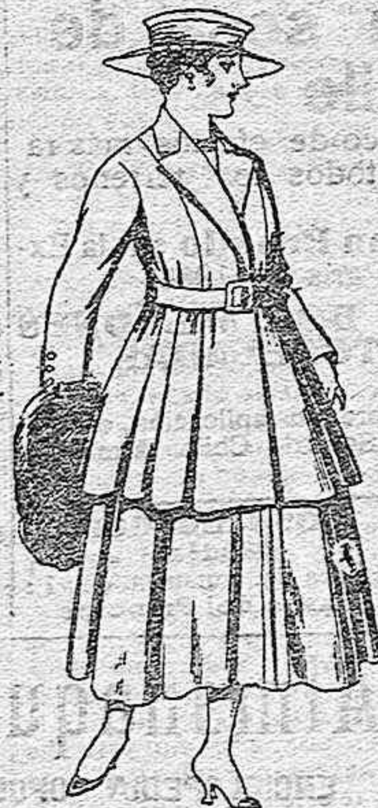
Traje de lana para señora, en color negro y azul, de pesetas 85 a 100.