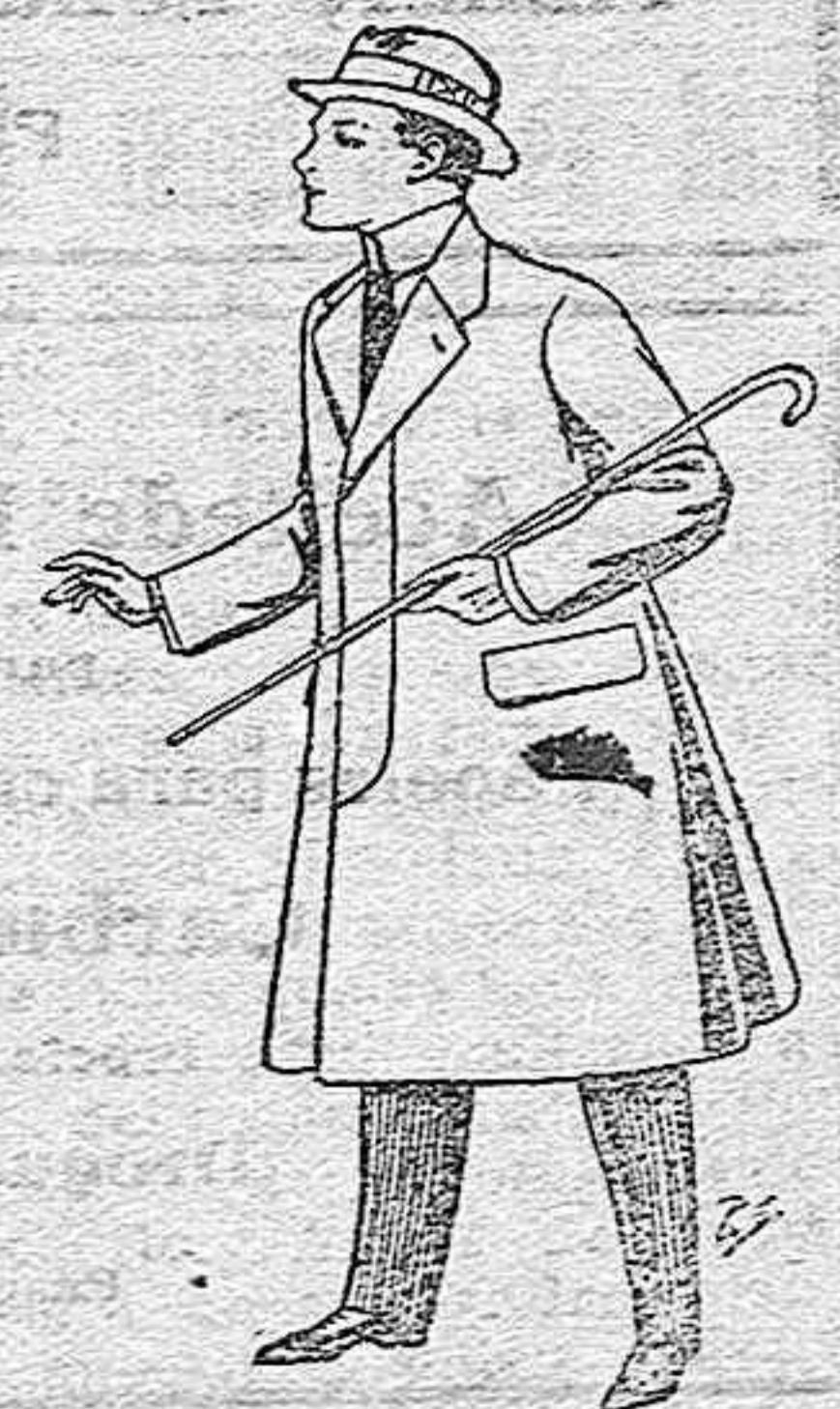
Gabanes de lana, vigenia o melton, con forros satén o seda, para niños de 10 a 12 años, de pesetas 20 a 53.