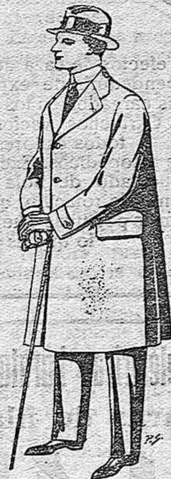
Gabanes de tejido pluma o ratina, de pesetas 33 a 106.