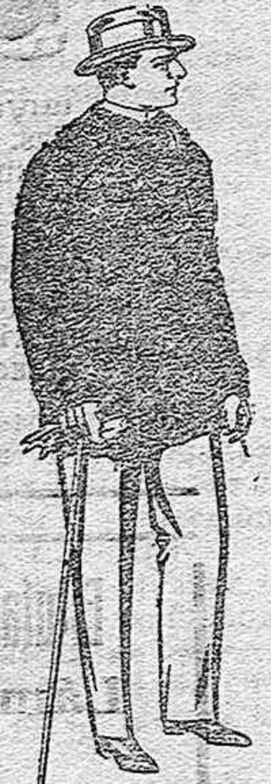
Pelliza de ratina con cuello del mismo género y con astrakan, de pesetas 33 a 110.