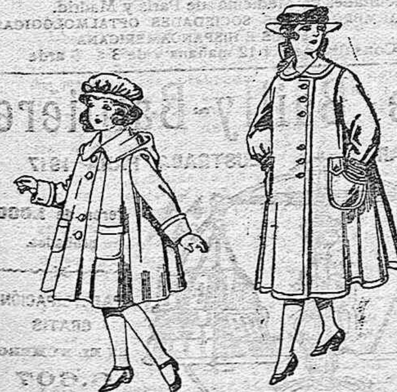
Abrigos de paten, para niñas de 4 a 9 años, de pesetas 22 a 33.