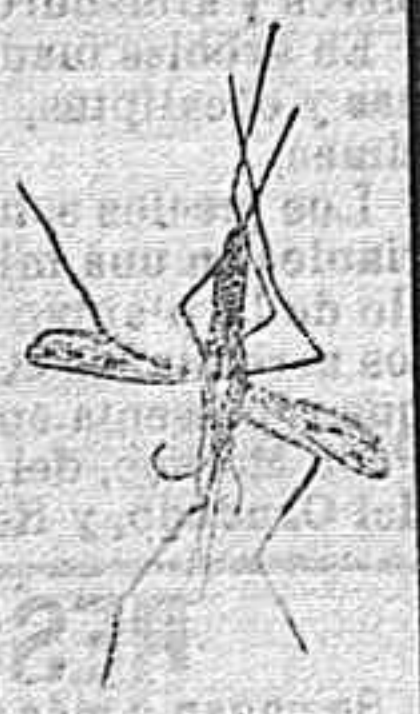
ANOFELE Mosquito que propaga la fiebre palúdica