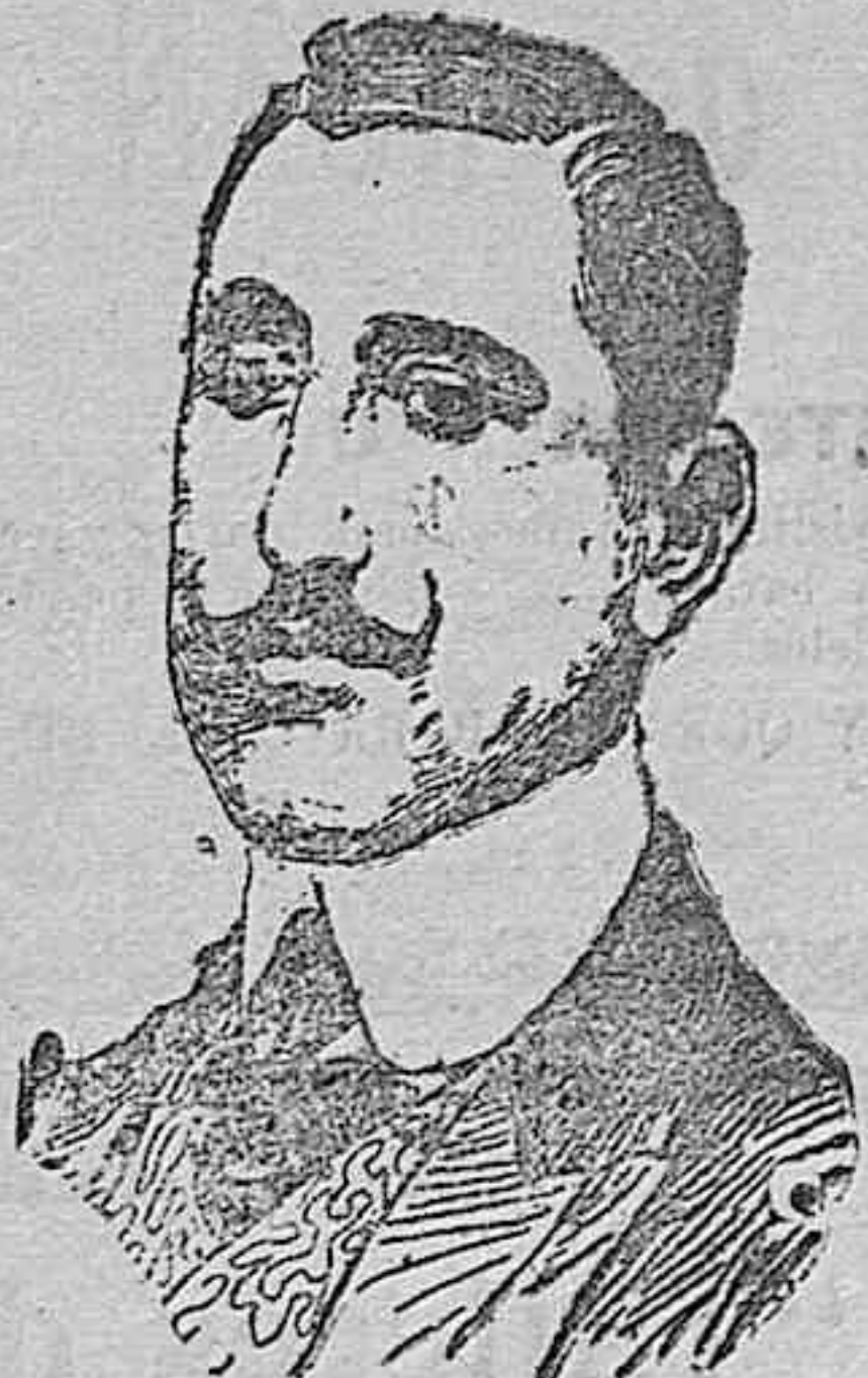
Don Gabriel Maura Gamazo, que acaba de ingresar en la Real Academia Española.