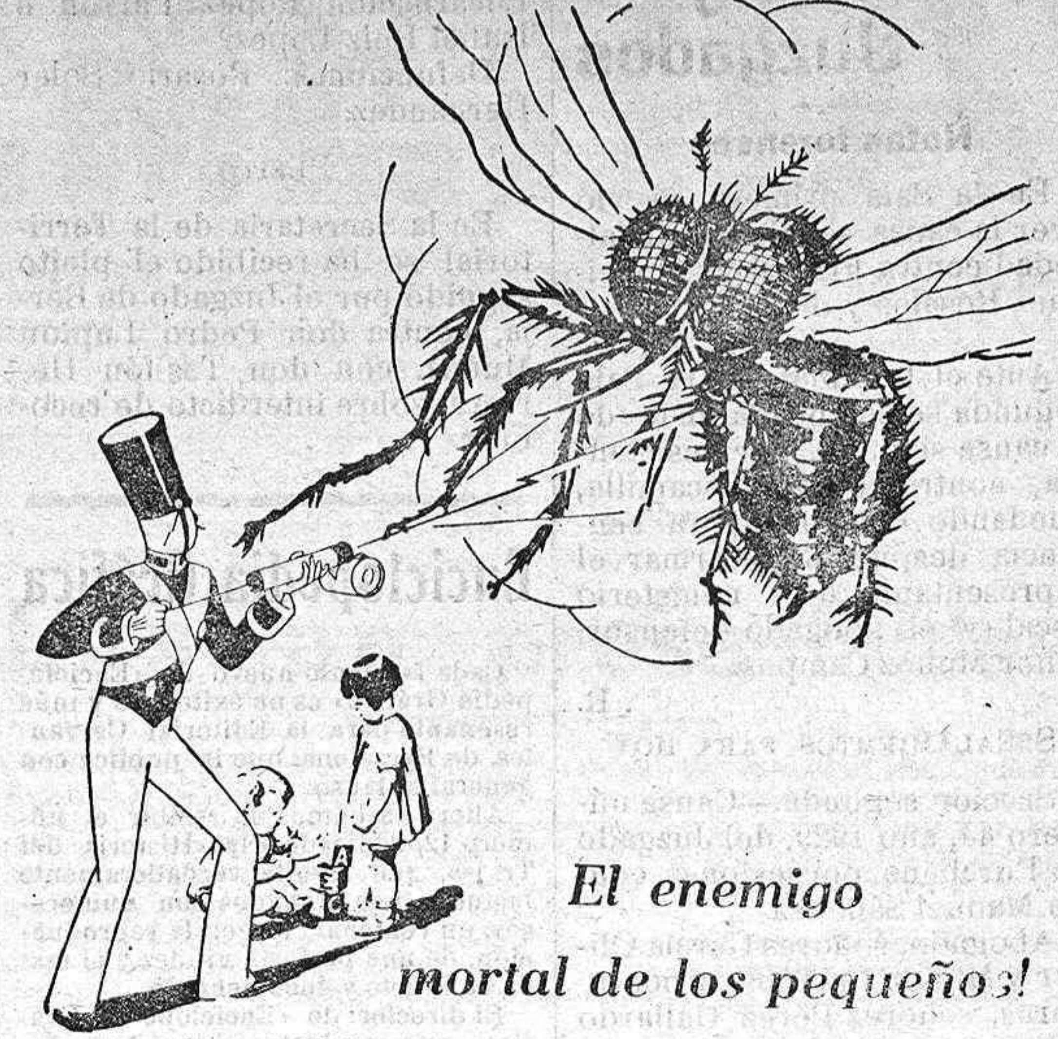
El enemigo mortal de los pequeños!

1 de cada 4 de los niños que mueren antes de los 5 años es víctima de la diarrea infantil. El principal propagador de esta enfermedad no es otro que la mosca común. Destruíd las moscas y salvad la vida de vuestros queridos bebés. Vaporizad Flit. Flit extermina moscas, mosquitos, pulgas, polillas, hormigas, escarabajos, chinches... y sus crías. No es peligroso. No mancha. No confunda Flit con los otros insecticidas. Bidón amarillo - franja negra. No se vende a granel. Exija los envases precluidos.