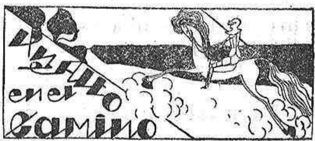
El reportero político

Hay algo que uno no quisiera ser nunca: reportero. Y menos que nada, reportero político. El reportero político es, generalmente, un hombre discreto, zafiro, vivo, listo, activo, ágil. Pero a fuerza de hacerse el tonto, de poner—deliberadamente—cara de tonto, es posible que su rostro de hombre normal adquiere para siempre rasgos de odreño. «La función crea el órgano», dijo hace tiempo un organista de iglesia.