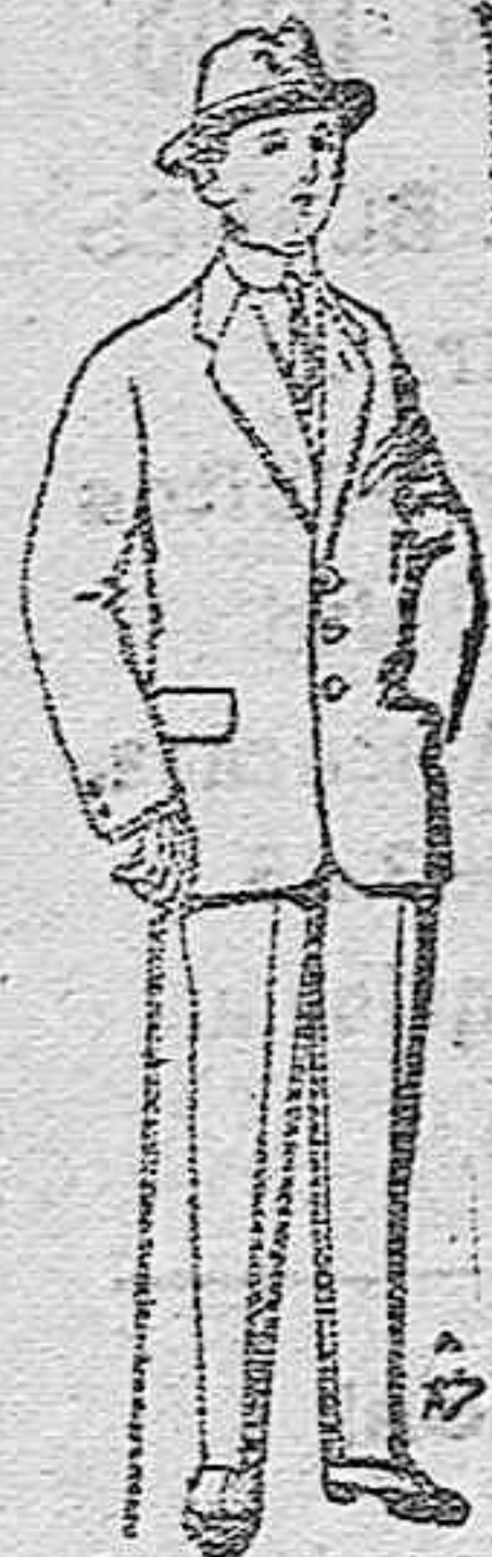
Trajes de patén vicuña ó jerga para niños de 10 á 16 años. De pts. 14 á 50