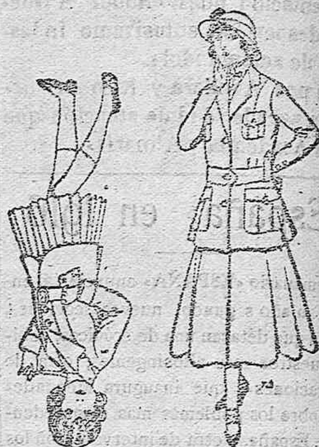
Trajes de lana para niñas de 4 á 12 años. De pesetas 20 á 35