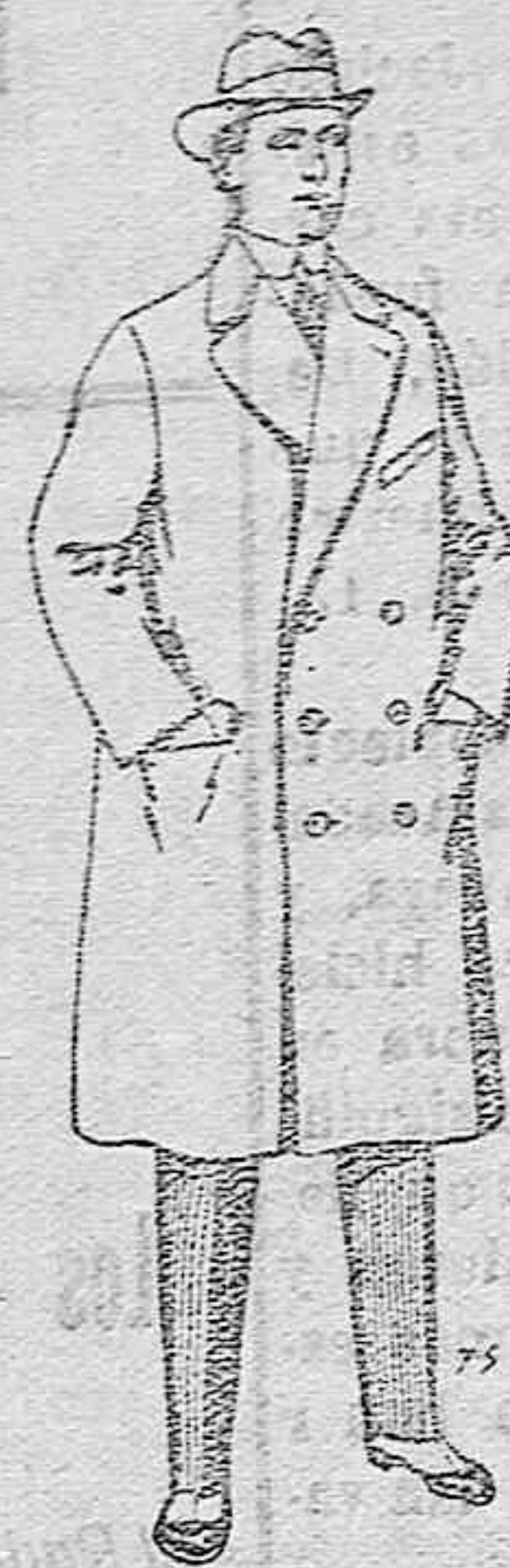
Gabanes de patén cheviot etc. De pesetas 55 á 105