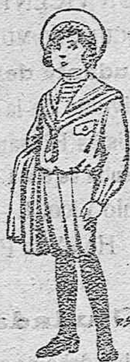
Trajes de jergal negra ó azul para niños de 4 á 9 años. De pts. 5 á 10