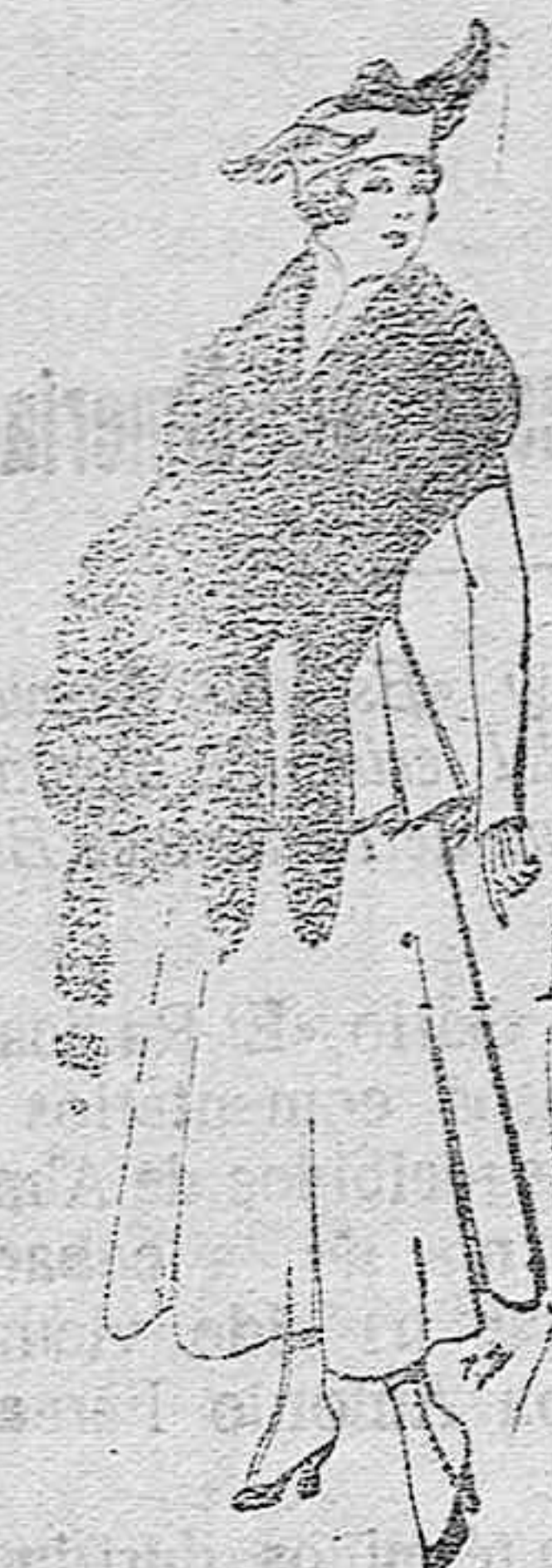
Juego de pieles imitación perfecta al renar-negro. De pts. 40 á 4d