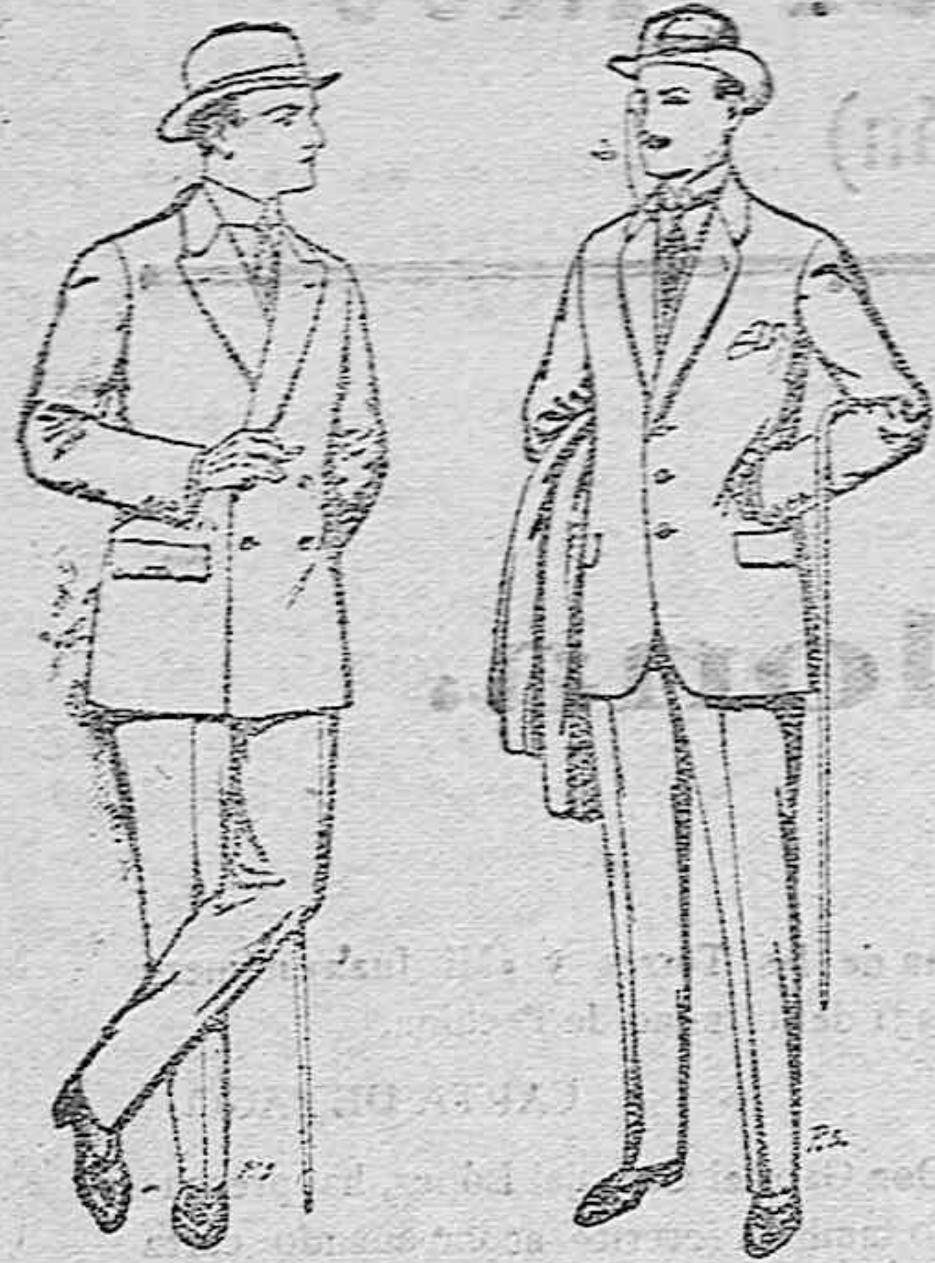
Trajes de cheviot patén, etc. De pesetas 27 á 85