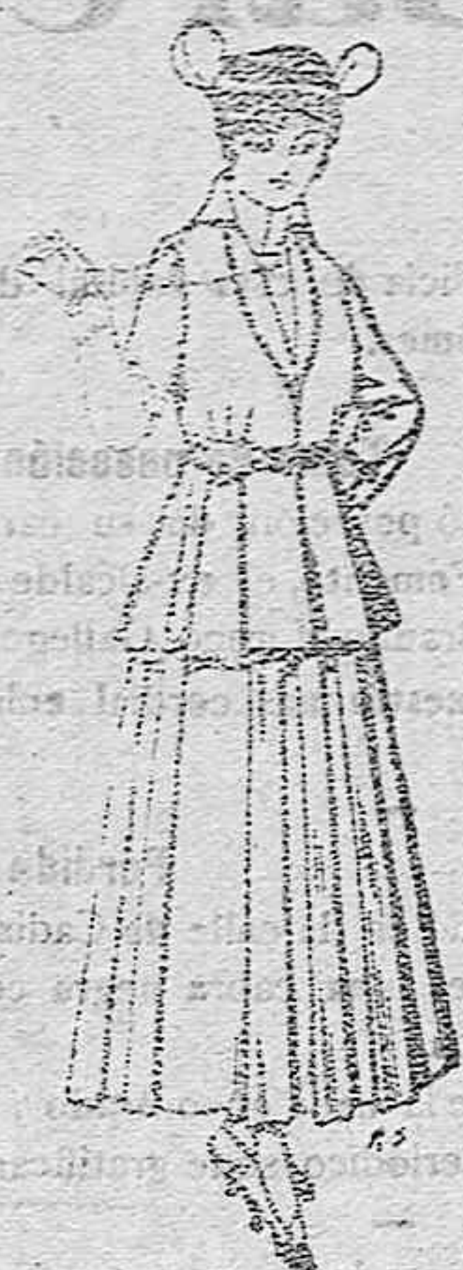
Trajes de lana negra, azul y de color, para señora. A pesetas 85,