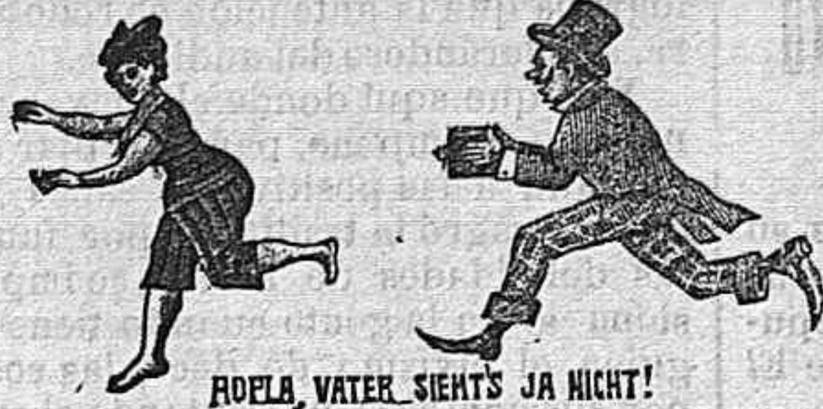
ROELA, WATER, SIEN'TS JA NICHT! ACCESORIOS FOTOGRAFICOS DE TODAS CLASES Laboratorio é instrucciones, gratis