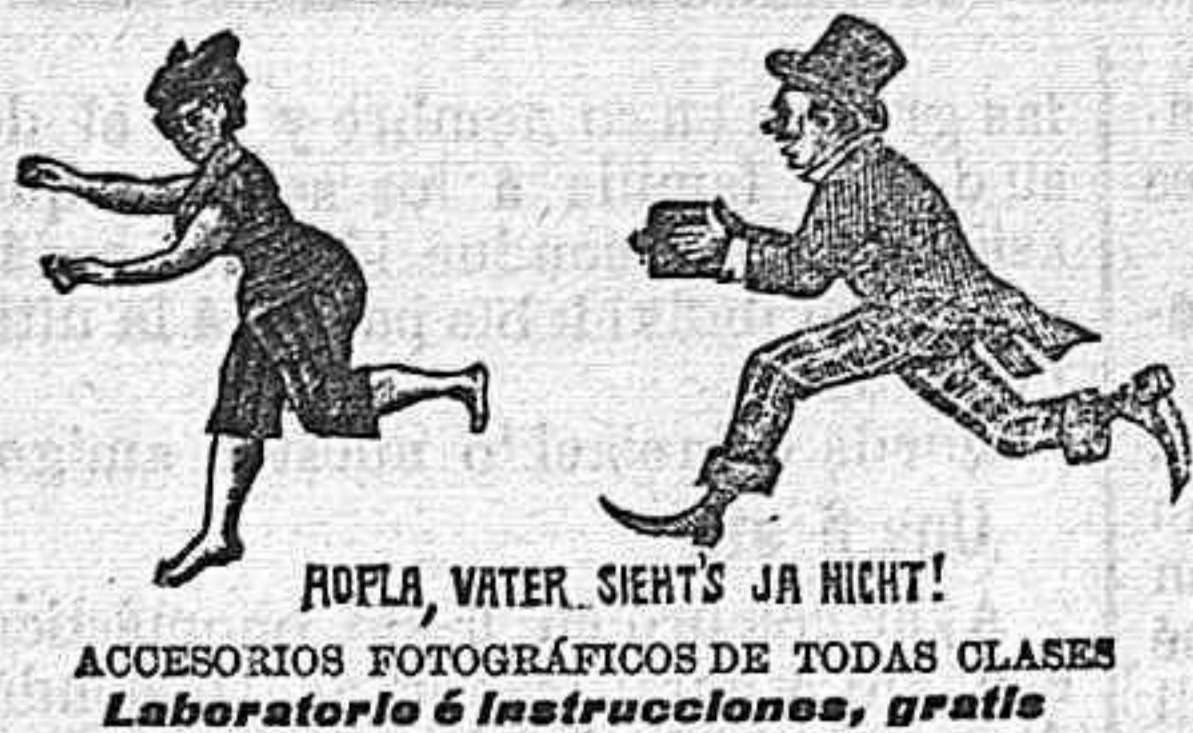
ROFLA, WATER, SIERT'S JA NICHT! ACCESORIOS FOTOGRÁFICOS DE TODAS CLASES Laboratorio é instrucciones, gratis

CÁMARAS FOTOGRÁFICAS PROPIAS PARA REGALOS Gran surtido á precios baratos CALLE DE GRANADA NÚM. 25, TELÉFONO 74.