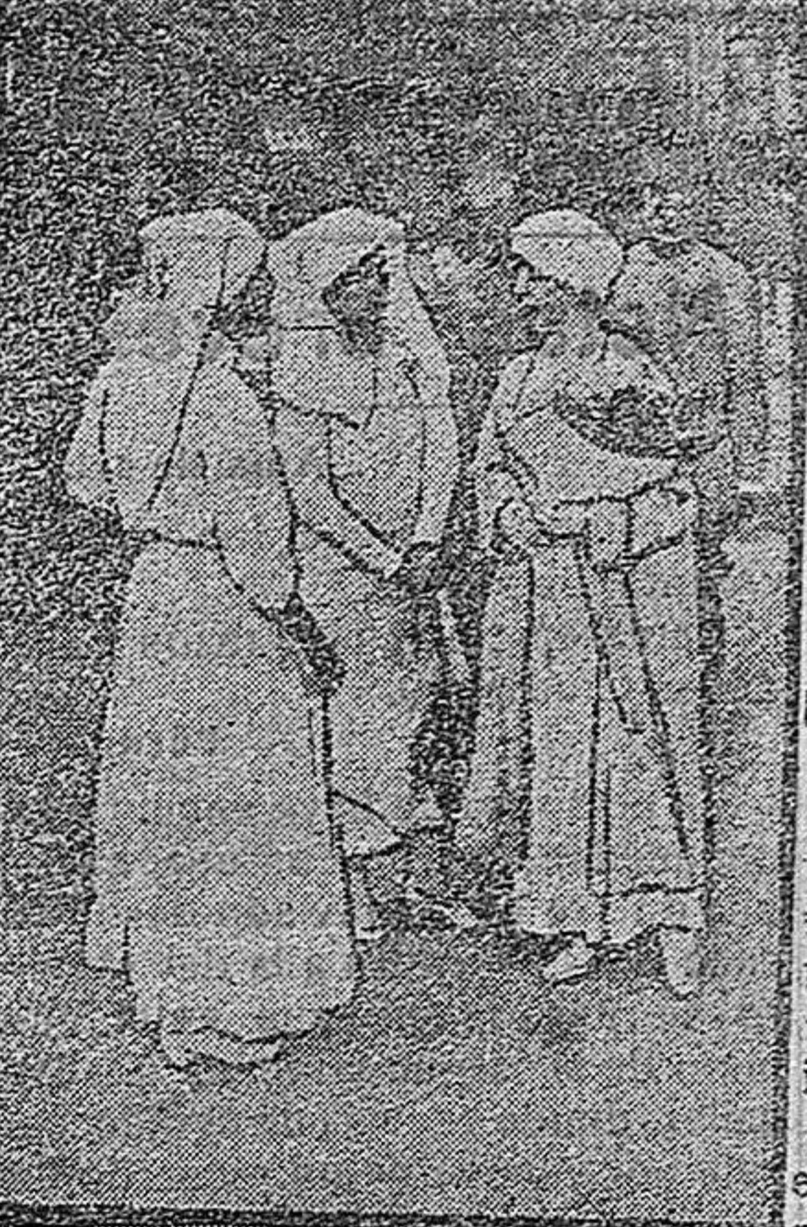
La reina de Bélgica visitando las ambulancias sanitarias francesas.