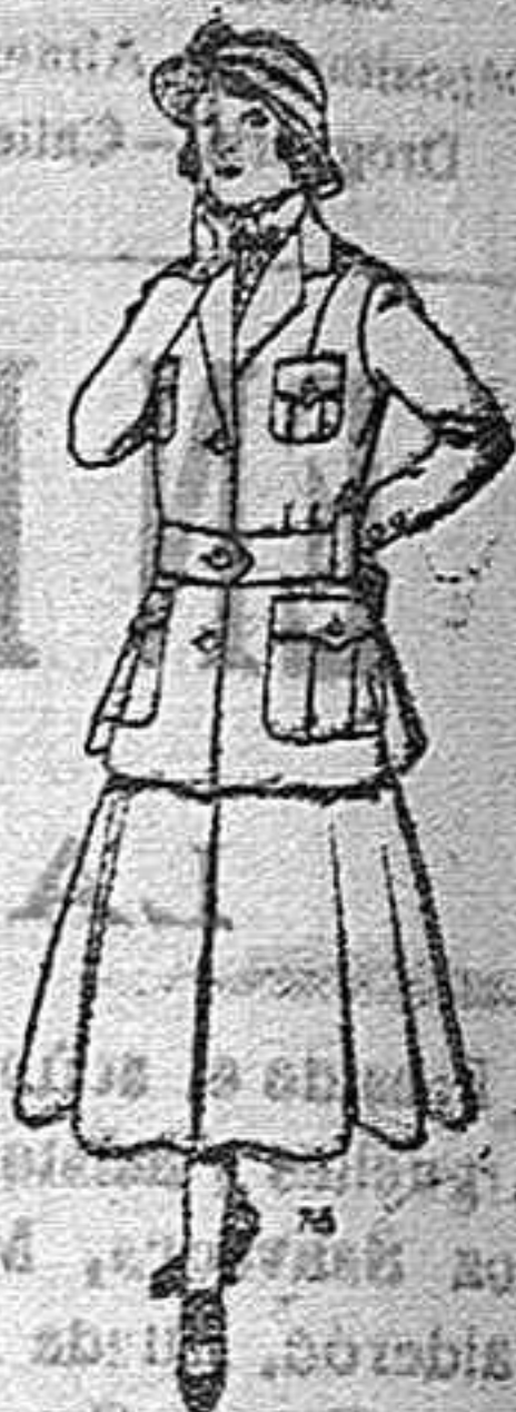
Trajes de lana para jovencitas de 12 á 16 años. De pesetas 40 á 45