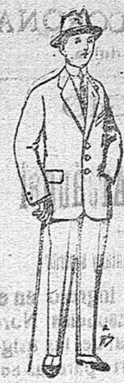
Trajes de patén vicuña ó jerga para niños de 10 á 16 años. De pts. 14 á 50