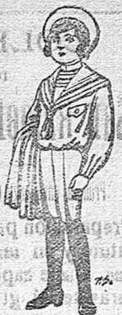
Trajes de jergal negra ó azul para niños de 4 á 9 años. De pts. 5 á 10.