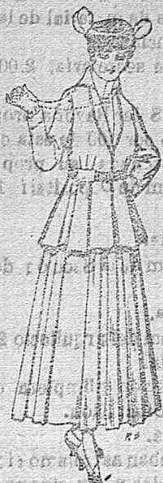
Trajes de lana negra, azul y de color, para señora. A pesetas 85.