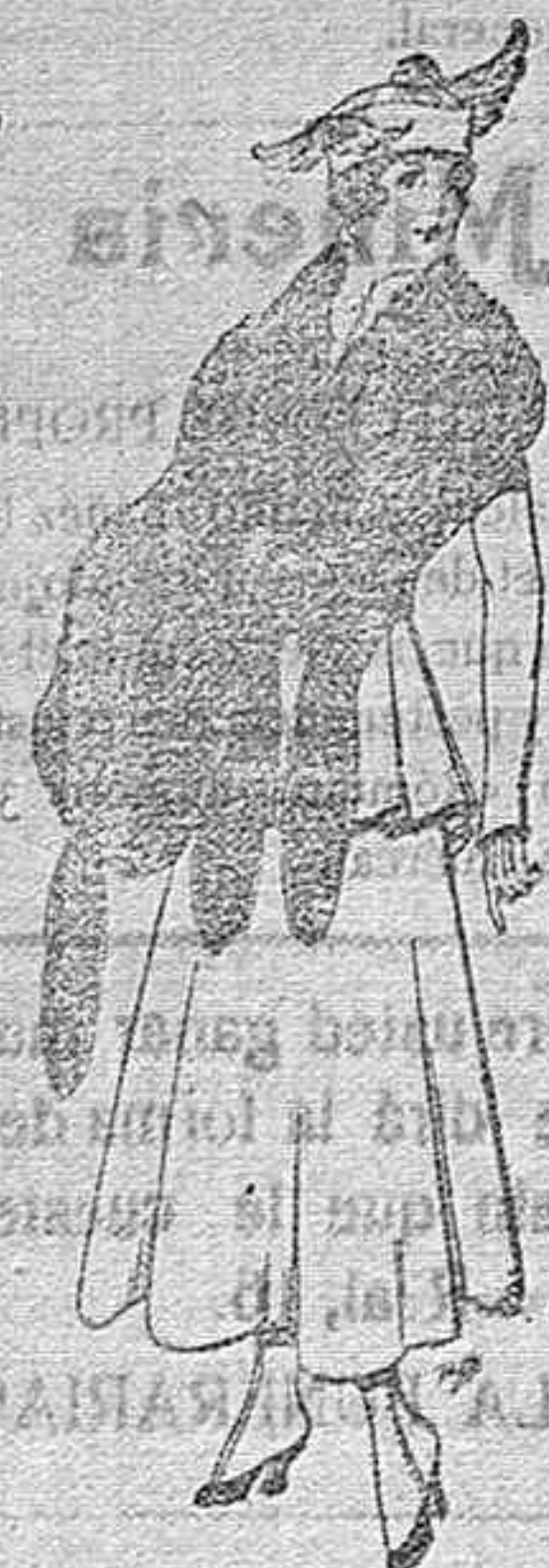
Juego de pieles imitación perfecta al renard negro. De pts. 40 á 4