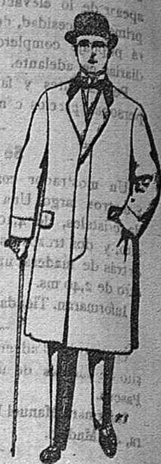
Gabanes de patén, ton y cheviot. De pesetas 25 á 160