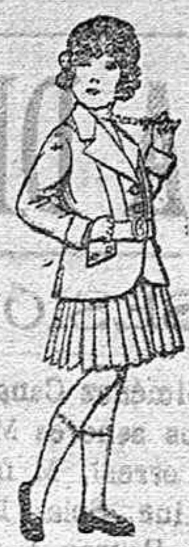
Trajes de lana para niñas de 4 á 12 años. De pesetas 20 á 35