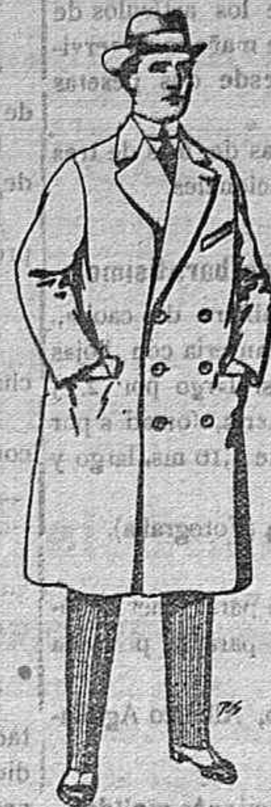
Gabanes de patén cheviot etc. De pesetas 55 á 105