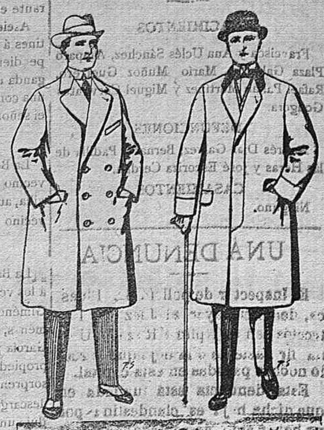
Gabanes de patén cheviot etc. De pesetas 55 á 105. Gabanes de patén, imitación y cheviot. De pesetas 25 á 100