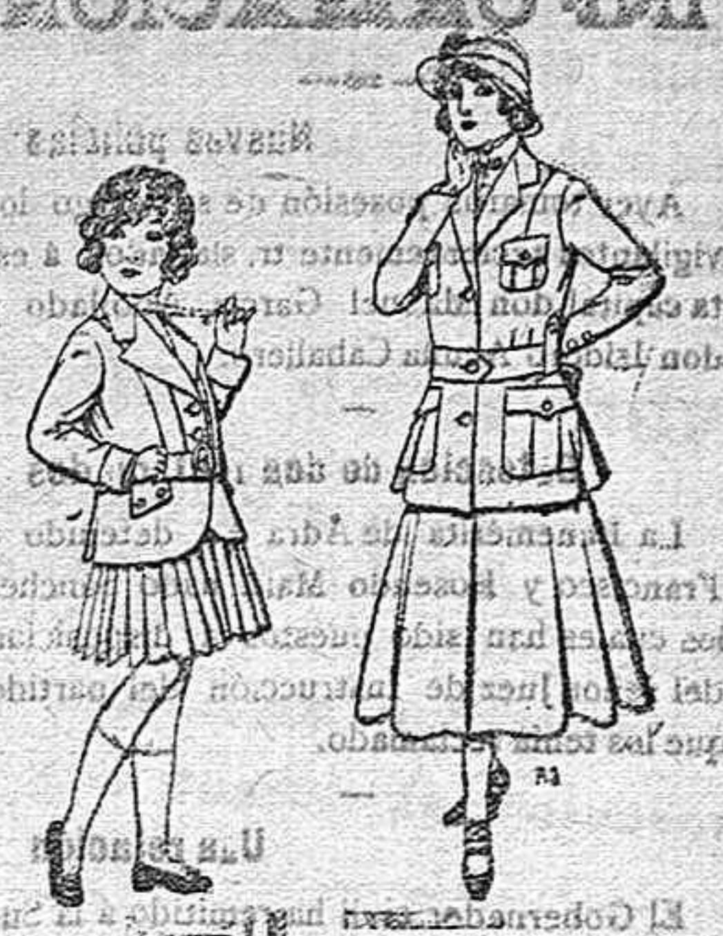
Trajes de lana para niñas de 4 á 12 años. De pesetas 20 á 35. Trajes de lana para jovencitas de 13 á 16 años. De pesetas 40 á 45.