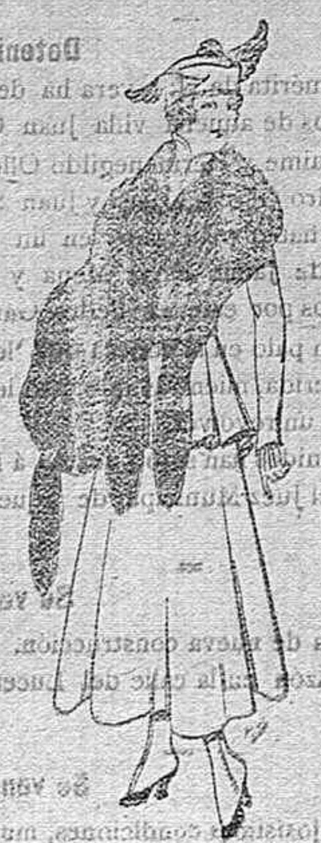
Juego de pieles imitación perfecta al renard negro. De pts. 40. á 45