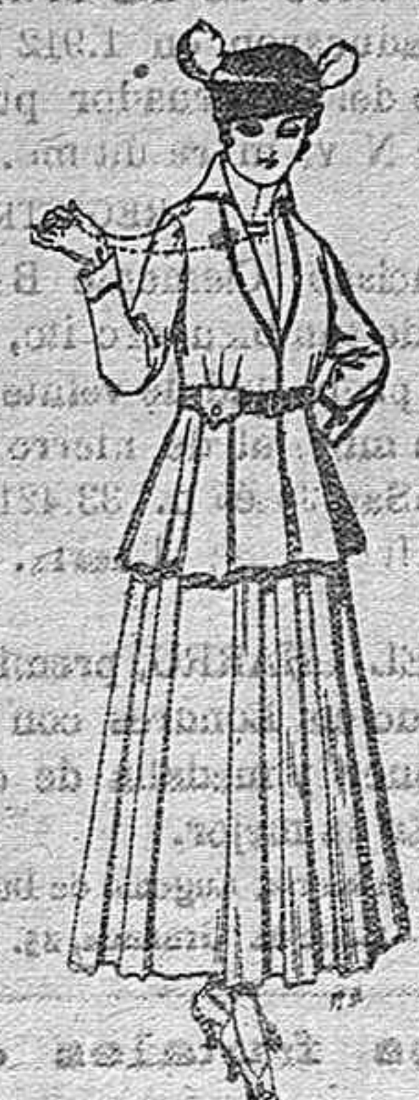
Trajes de lana negra azul y de color, para señora. A pesetas 85.