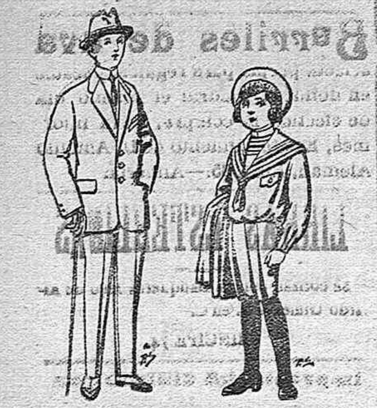
Trajes de patén vicuña ó jerga para niños de 10 á 16 años. De ptas. 14 á 50. Trajes de jerga negra ó azul para niños de 4 á 9 años. De ptas. 5 á 10.