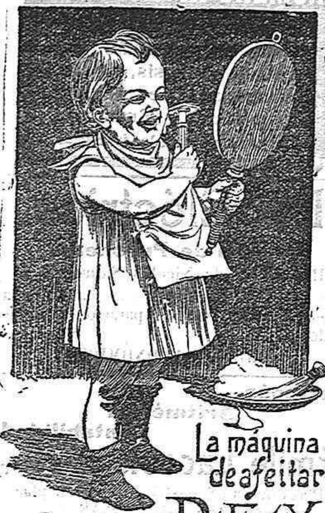
La máquina de afeitar "PHOENIX"