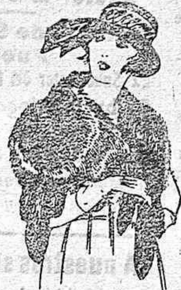
Cuellos para jovencitas, imitación Renardina de ptas 22 a 40