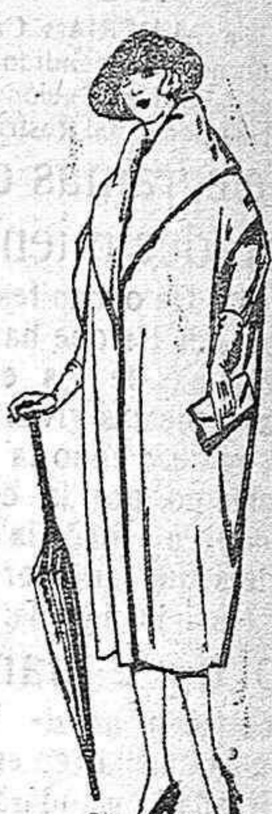
Capas de gabardina, paño, etc. diferentes colores de ptas. 127 a 160