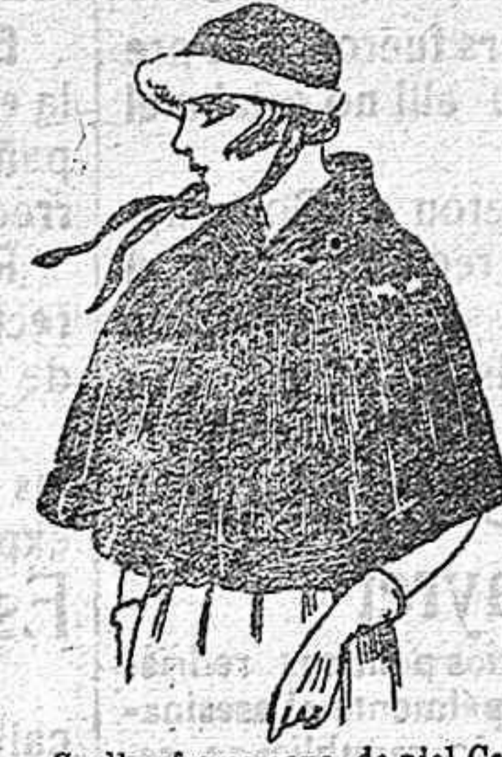
Cuellos forma caps, de piel Colombia marrón de ptas. 180 a 200