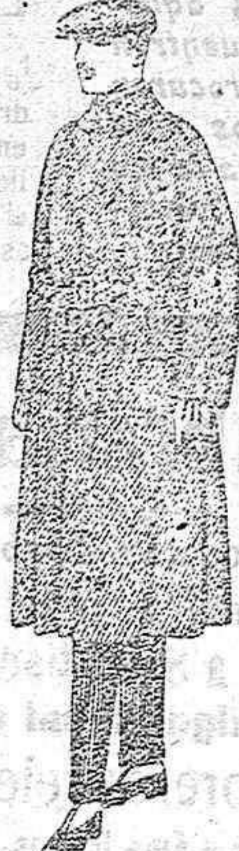
Gabanes de patén, cheviot o cover de ptas. 90 a 160