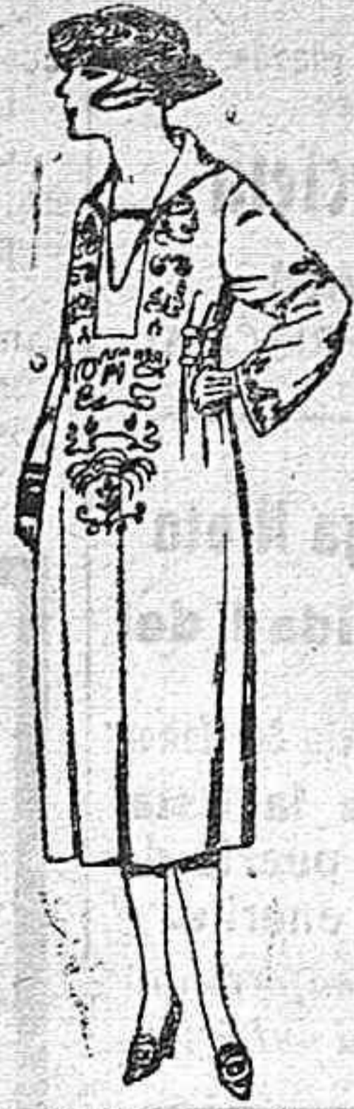
Vestidos de lanilla, estambre, gabardina, etc. en negro, azul y color, adornos bordados de ptas. 90 a 120