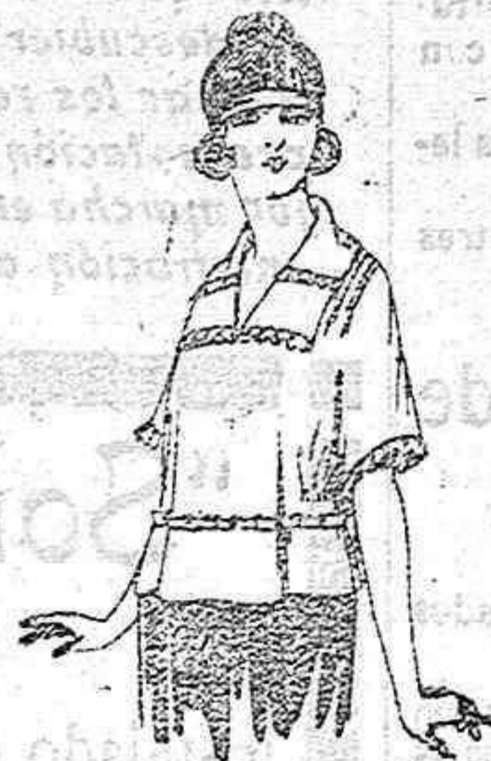
Blusas de crasón de seda, granadine, charmeuse, etc. de ptas. 46 a 70