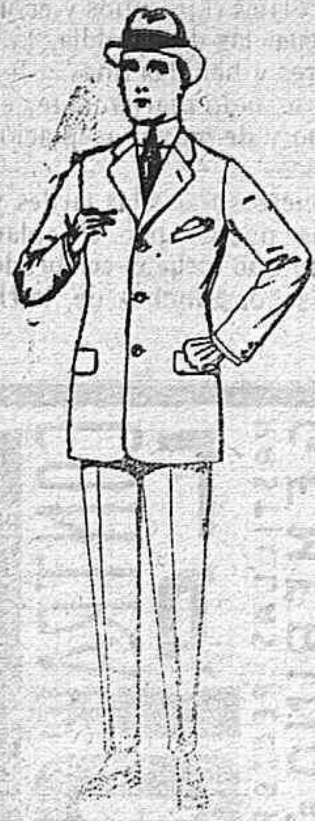
Trajes de cheviot, corte elegante, para Sportman, de ptas. 60 a 190