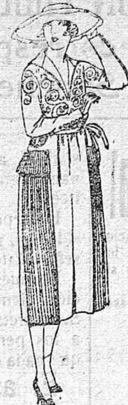
Vestidos de lanilla, gabardina, estambre, etc., en negro, azul y color, adornos bordados de ptas. 110 a 180