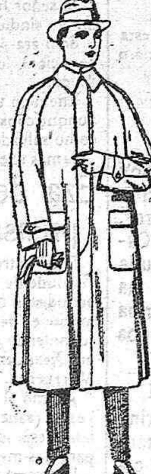
Impermeables raglán, en azul y colores de pta. 45 a 180