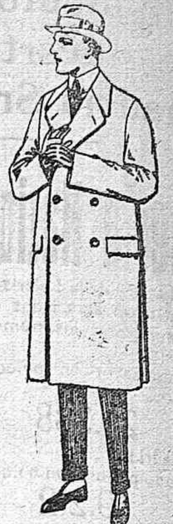
Gabanes de patén, gamuza o cover de ptas. 70 a 190