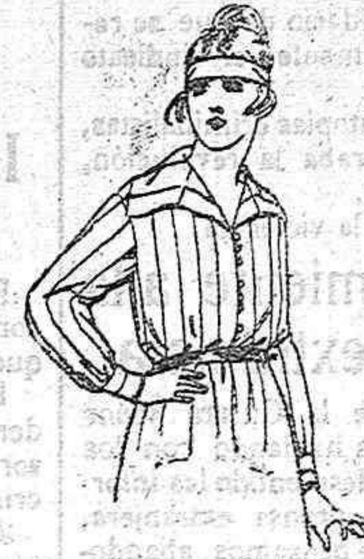
Blusas de franela listadas de ptas. 9 a 16