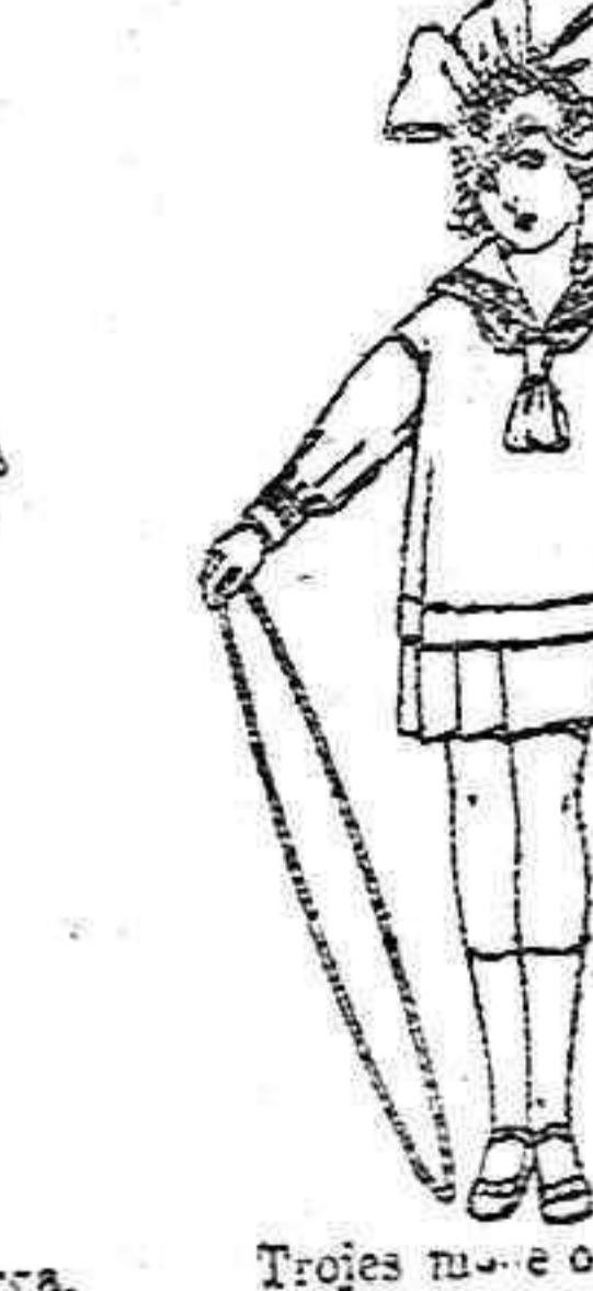
Trojes nubes o «Marinera nubes», de sarga, azul y color, para niñas de 4 a 9 años de ptas. 45 a 70