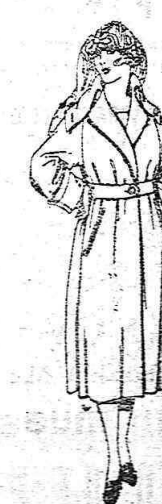
Abrigos de gabardina inglesa impermeabilizada, en negro, azul y color de ptas. 115 a 200