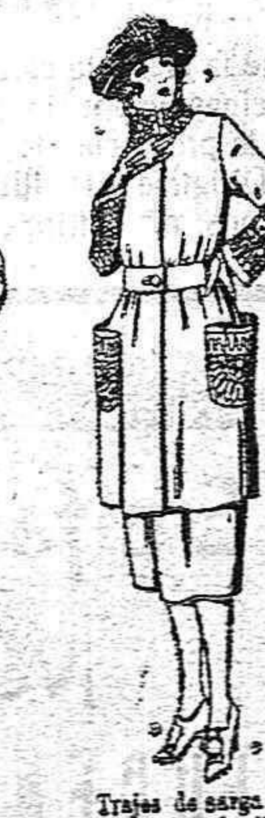
Trojes de sarga inglesa, estambre, etc. en negro, azul y color, adornos bordados de ptas. 145 a 165

Ropas confeccionadas para caballeros, señoras niños y niñas. Peletería Camisería Géneros de punto, Corbatería, Guantería, Sombrerería, Zapatería, Paraguas, Bastones y artículos de viaje. Precios fij. PIDASE EL CATALOGO GENERAL Ventas al contado.