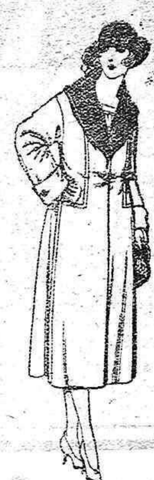
Abrigos de gamuza, pade, en negro, azul y color, adornos terciopelo negro de ptas. 120 a 150