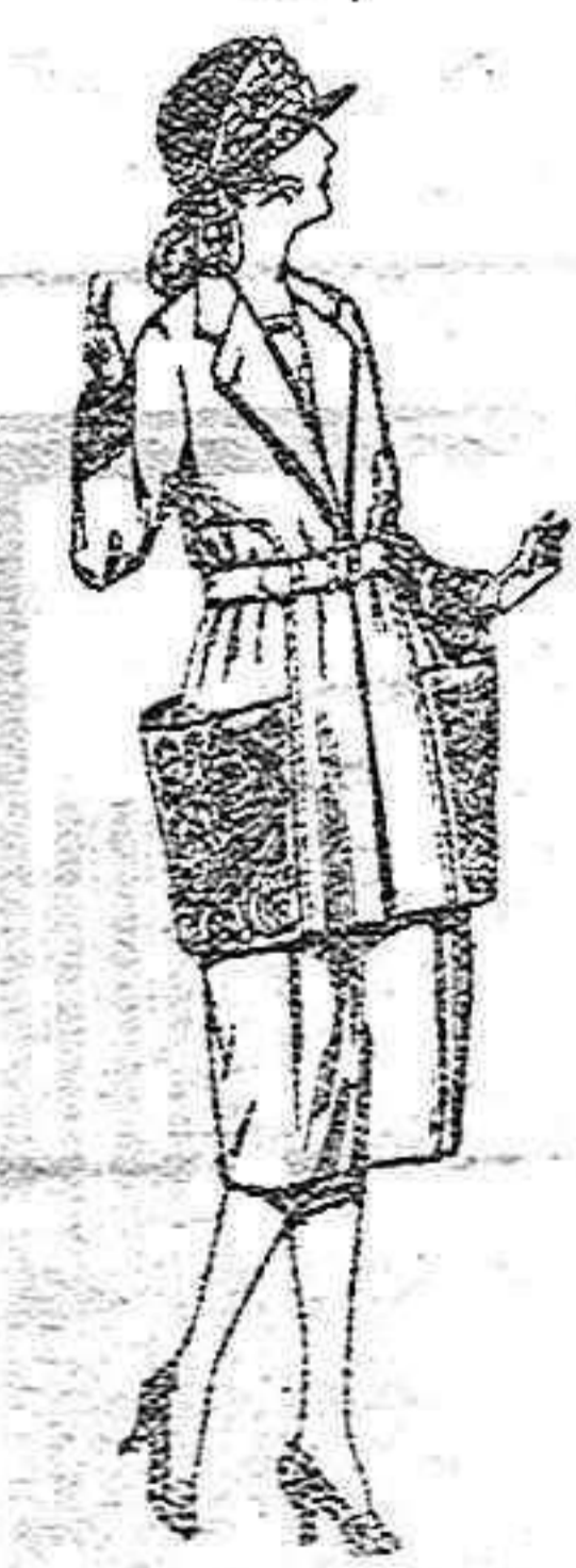
Trojes de gabardina, lanilla, sarra inglesa, etc. en azul y color, adornos bordados de ptas. 100 a 130