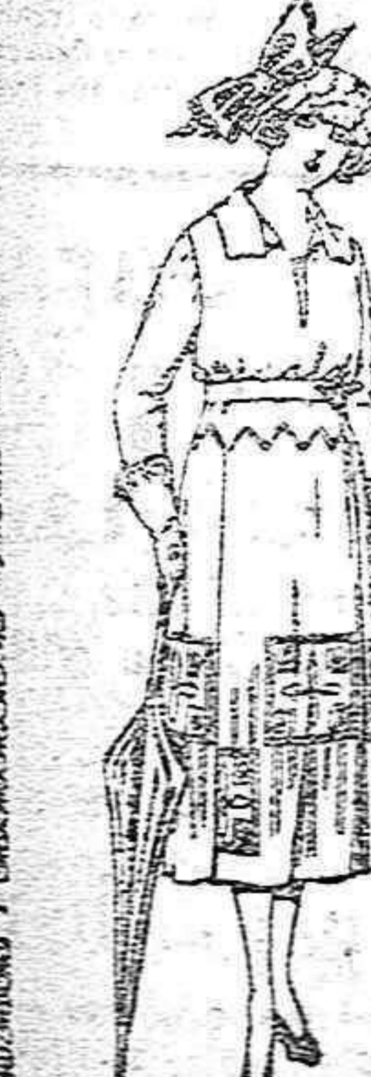
Vestidos de sarga inglesa, estambre, etc. en negro, azul y color, adornos bordados de ptas. 115 a 150