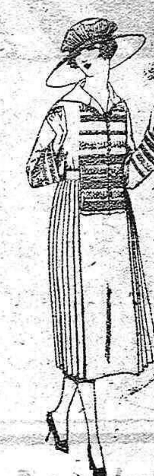
Vestidos de sarga inglesa, lanilla, etc., en negro, azul y color, adornos bordados de ptas. 100 a 145