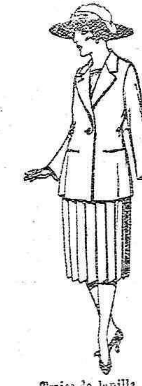
Trojes de lanilla, sarra, etc. en azul y color de ptas. 90 a 100