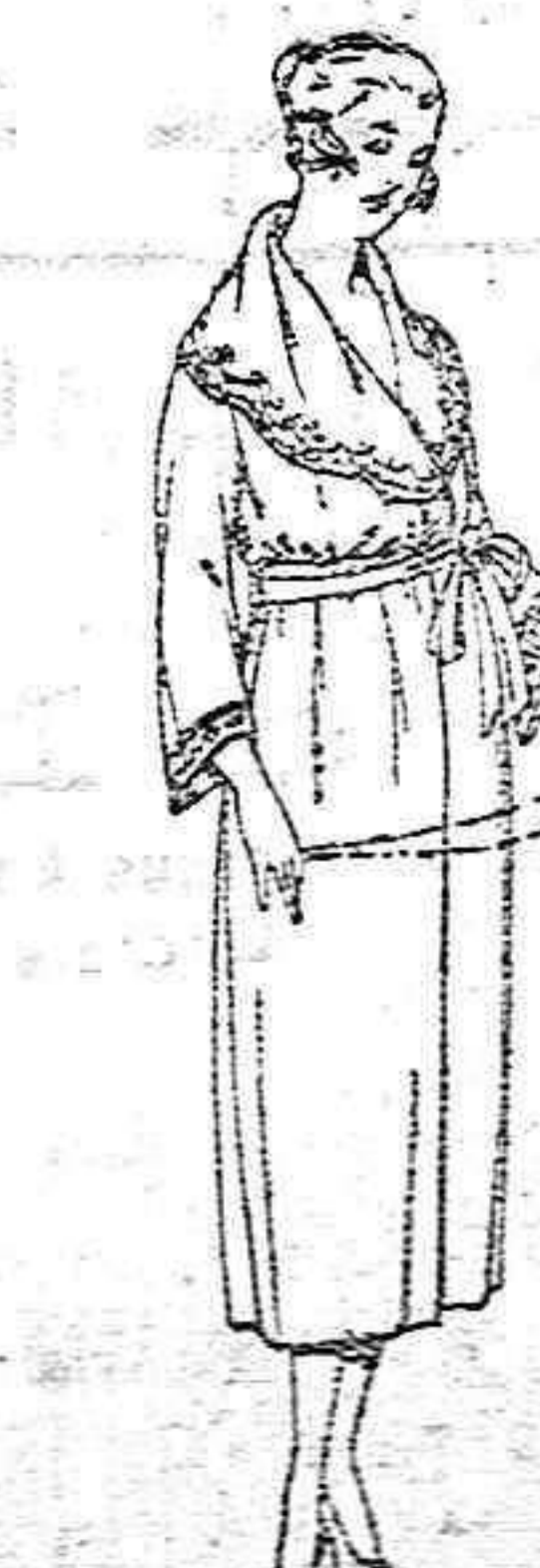
Batas francesas, diferentes colores, en algodón y de marino de ptas. 20 a 60