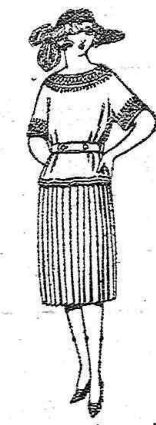
Vestidos de sarga inglesa, estambre, en azul y color, adornos bordados de ptas. 65 a 90