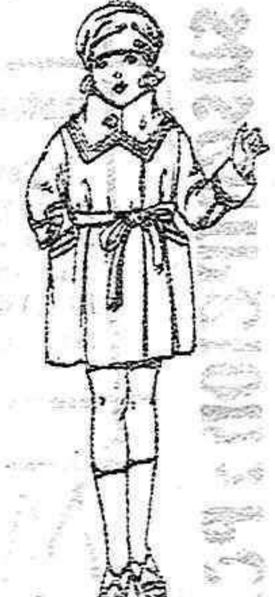
Abrigos de terciopelo en azul y color, para niñas de 4 a 9 años