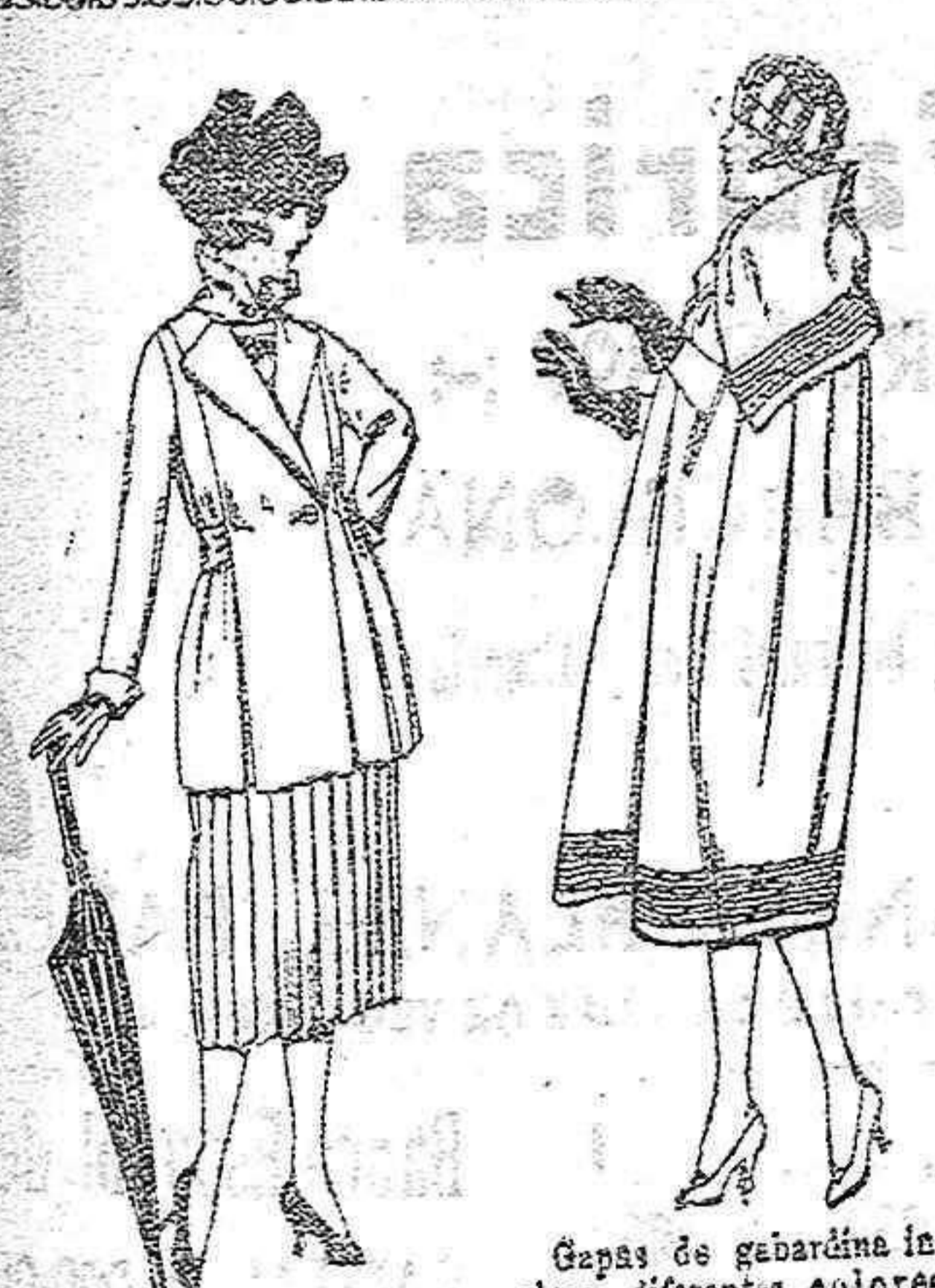
Trojes de gabardina, lanilla, estambre, etc. en negro, azul y color de ptas. 150 a 165

7, Príncipe Alfonso, 7. -Almería Sucursales: Madrid, Barcelona, Alicante, Bilbao, Cádiz, Cartagena, Gijón, Granada, Málaga, Palma de Mallorca, Santander, Sevilla, Valencia, Valladolid, Zaragoza.