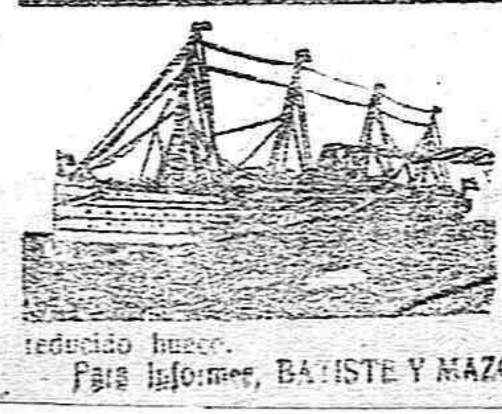
Para informes, BASTISTE Y MAZO. General S. gura.

Vapores fruteros Lina Troyá de Barcelona Para Liverpool de ceto el magnífico y rápido vapor Torre del Oro se encuentra en puerto a la carga con reducido buque. Para informes, BASTISTE Y MAZO. General S. gura.